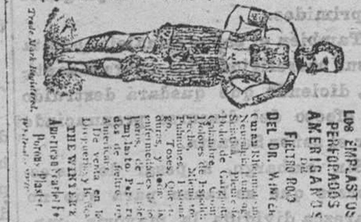
Los Emplastos Perforados Americanos de Fieltro Rojo del Dr. Winter.

EMPLASTOS PERFORADOS AMERICANOS DE FIELTRO ROJO DEL DR. WINTER Los emplastos perforados americanos de fieltro rojo del Dr. Winter, son un remedio muy eficaz para el tratamiento de las afecciones de la piel, como el eczema, la dermatitis, el herpes, etc. Este emplastro se aplica sobre la parte afectada y se deja en su sitio durante algunas horas. Los resultados son muy satisfactorios.