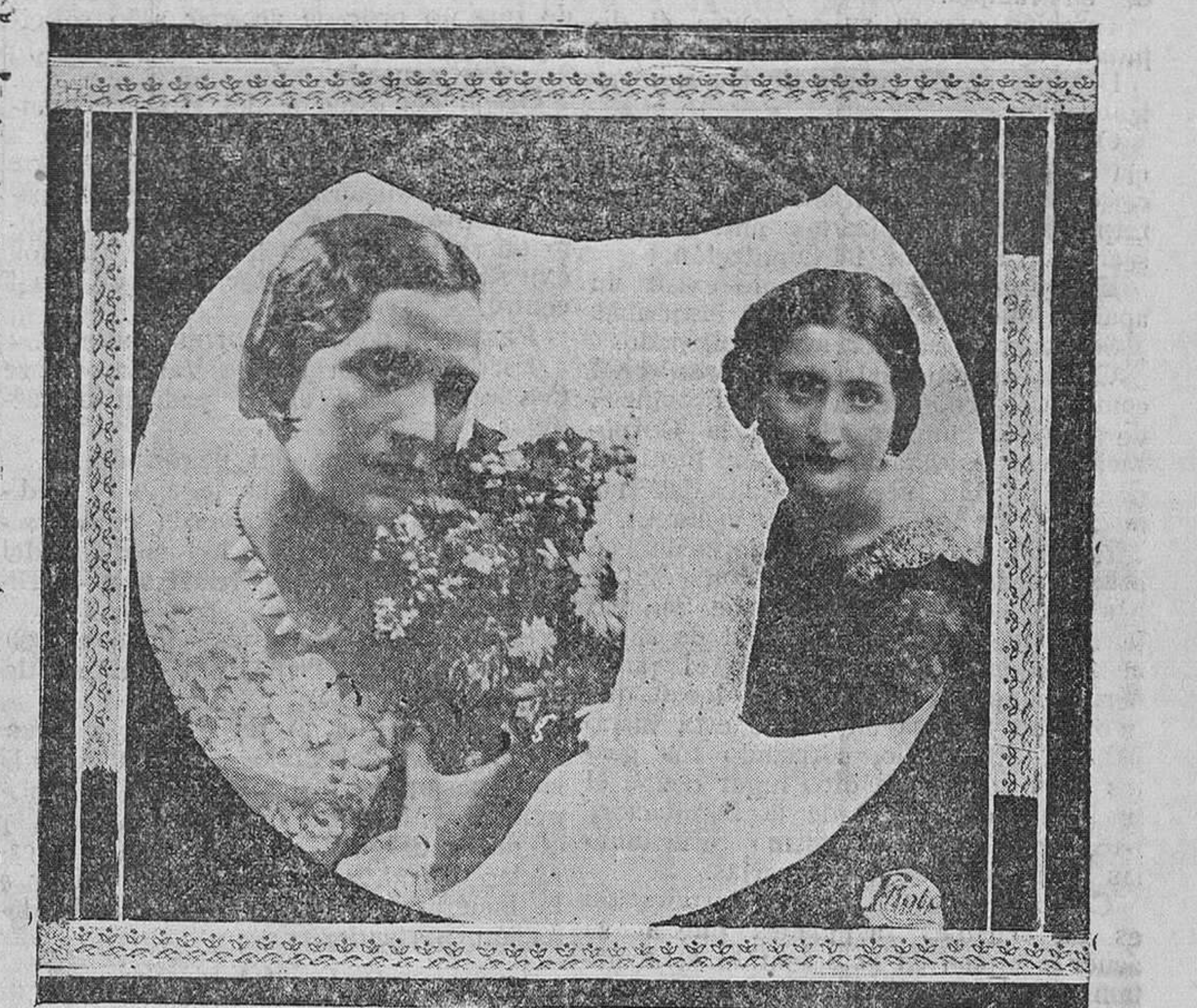
LEMAS: 13.º, «CAPULLO DE PRIMAVERA», 4.º, «BENAMOR»

Esta noche, a las doce, termina el plazo de admisión de fotografías; lo recordamos puesto que, si hubiese alguna retrasada, aún tiene tiempo de presentarse, pues pasada dicha hora no admitimos ninguno, ya que el concurso se ha de hacer con toda legalidad y formalidad.