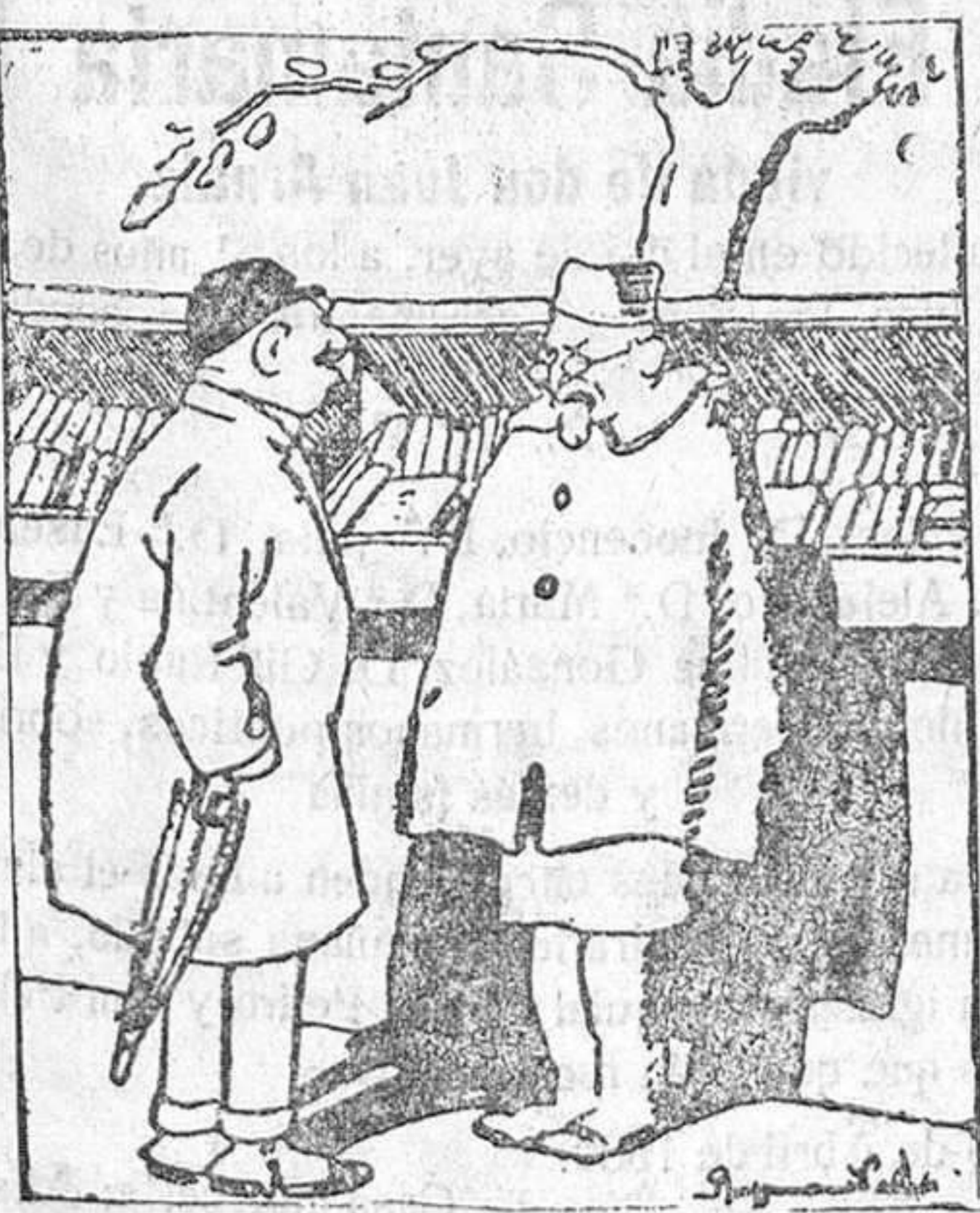
—¿Tendría por casualidad un pequeño manuario de agricultura? Presento mi candidatura por el distrito agrícola.