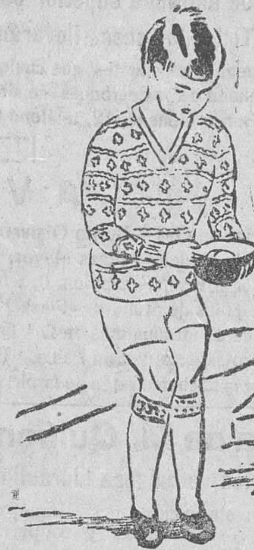
SUETERS FINOS dibujos ingleses desde 4 pesetas.