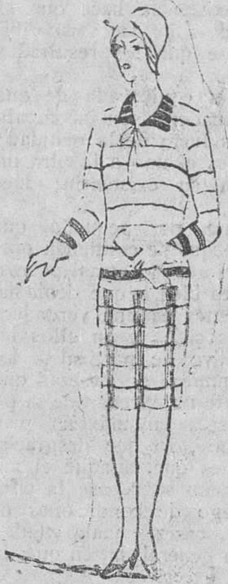
Modelo "GIRLS" paseos matinales 22'75 pesetas