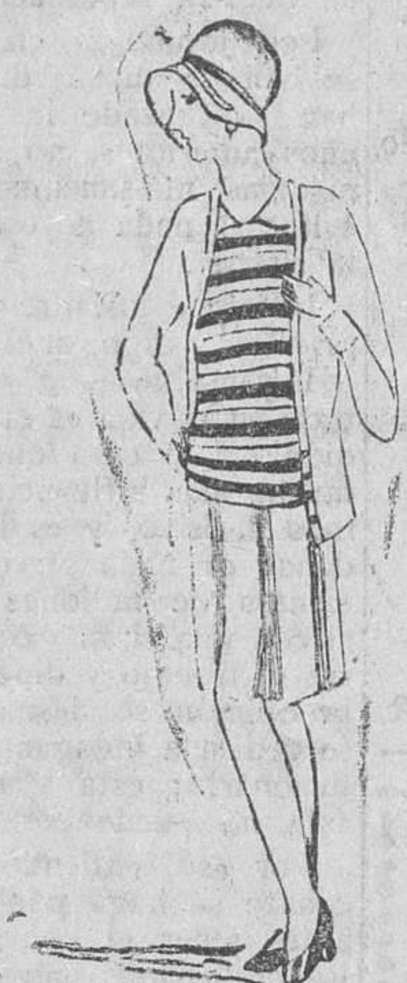
Modelo "BOULEVARD" punto muy fino inglés, traje completo, 3 prendas 48 pesetas