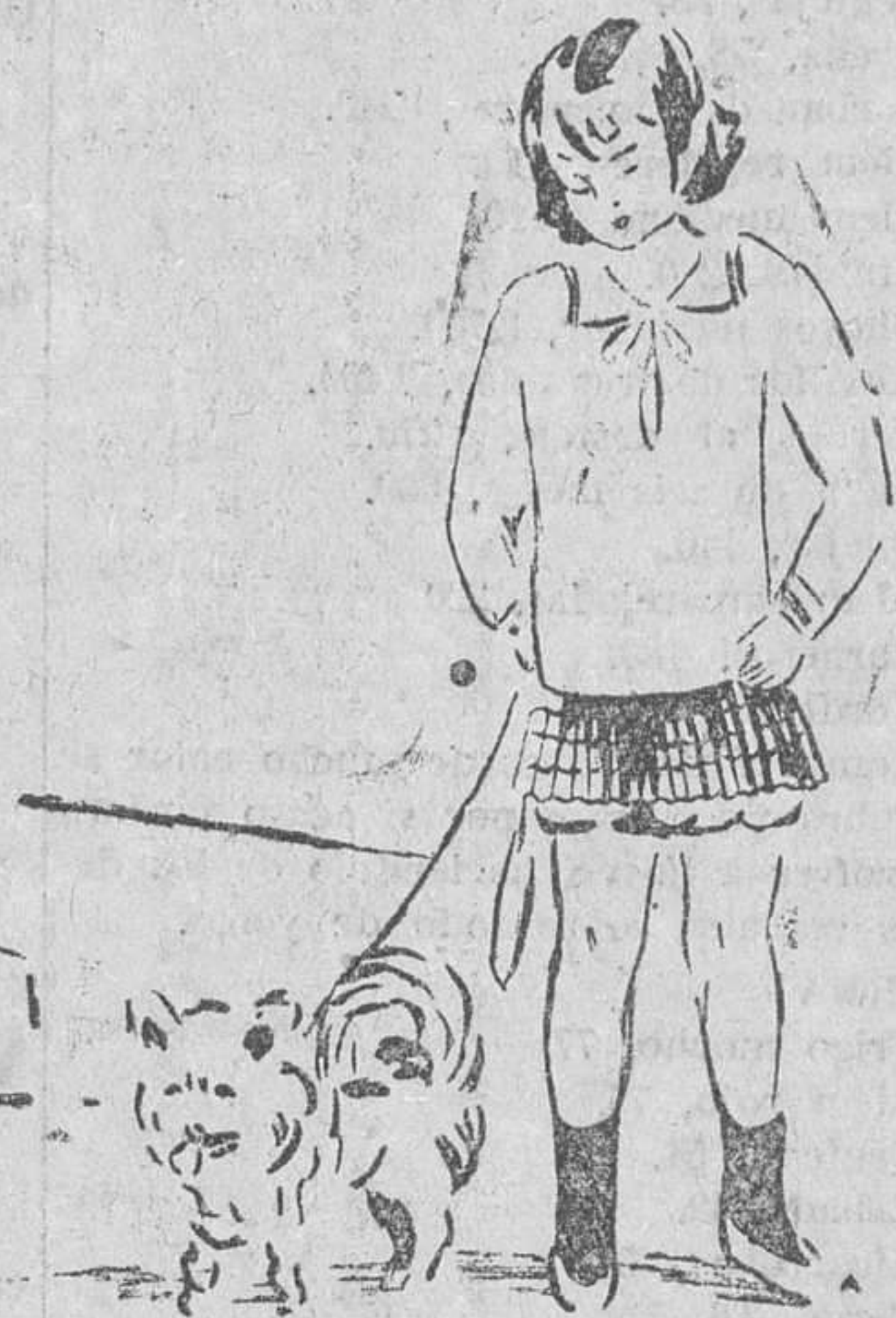
TRAJE NIÑA infinidad de modelos, a cual más bonito, desde 7'50 pesetas