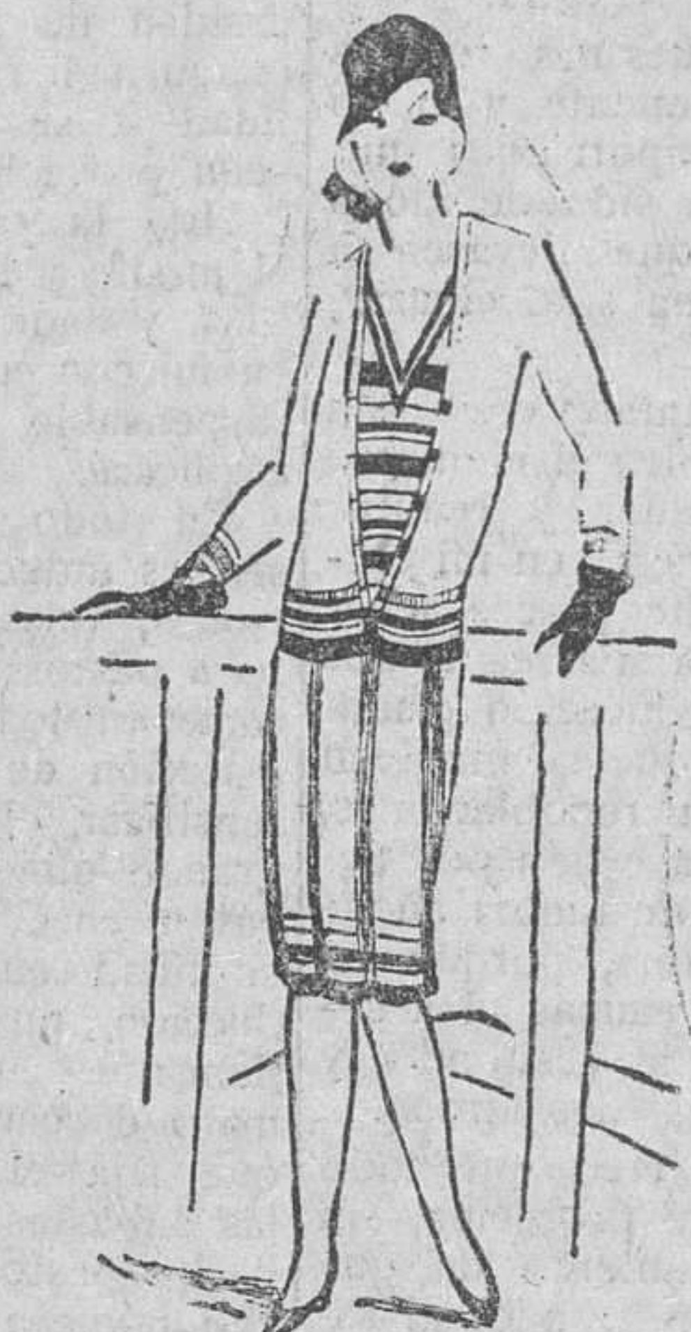
Modelo "PRINTEMPS" tejido esponja lana-seda, traje completo, 3 prendas 35 pesetas