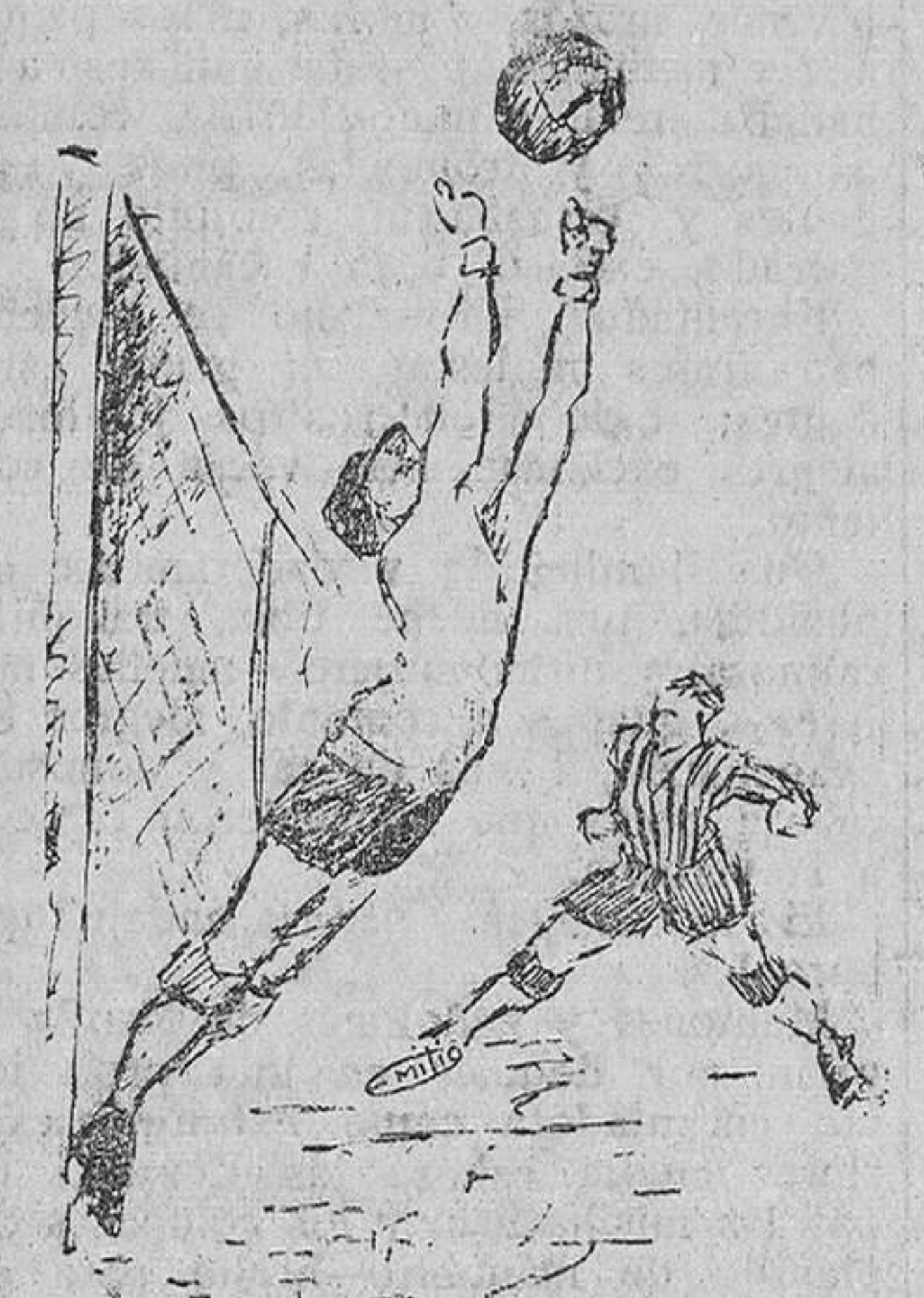
Estirada del portero irunés

ra ganar pesetas, pues había muchas localidades y... mucha gente en el «teatro» de los sastres.