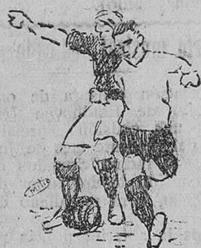
Disputándose el balón