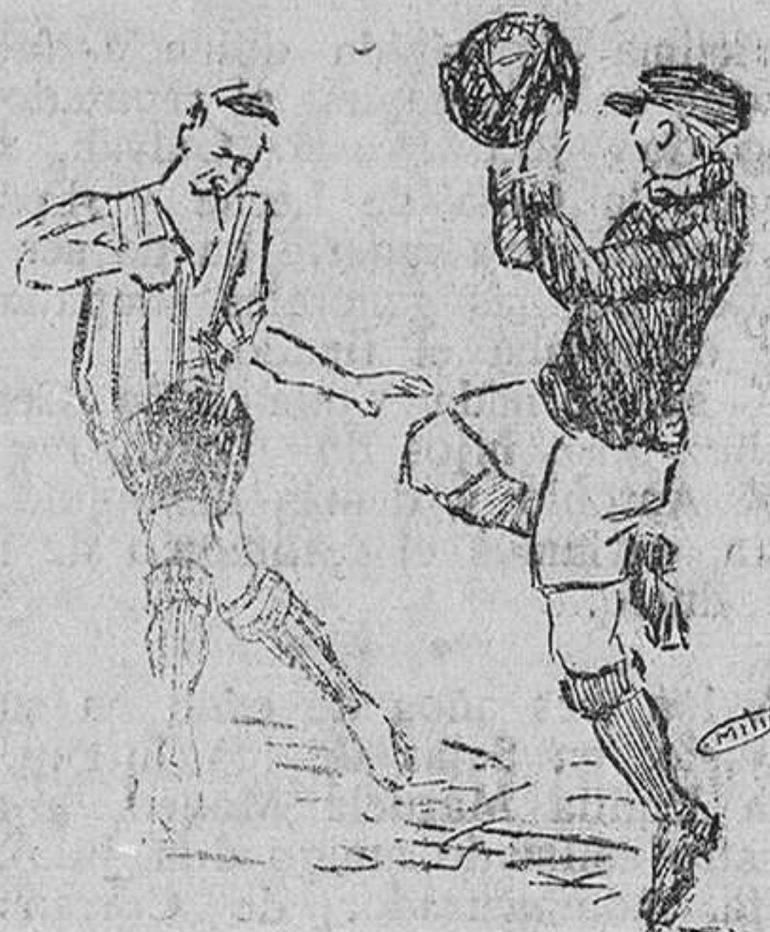
Una parada de Beristain

La jugada es ovacionadísima y después de unos momentos de do-