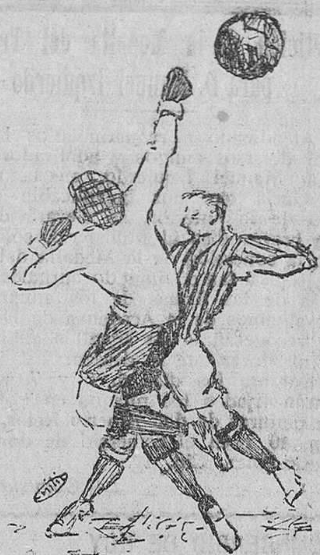
Un despeje de Emery

El Irún, sigue imponiéndose y aunque hay alguna escapada de los alavéses, es cortada por backs o medios, que aho-