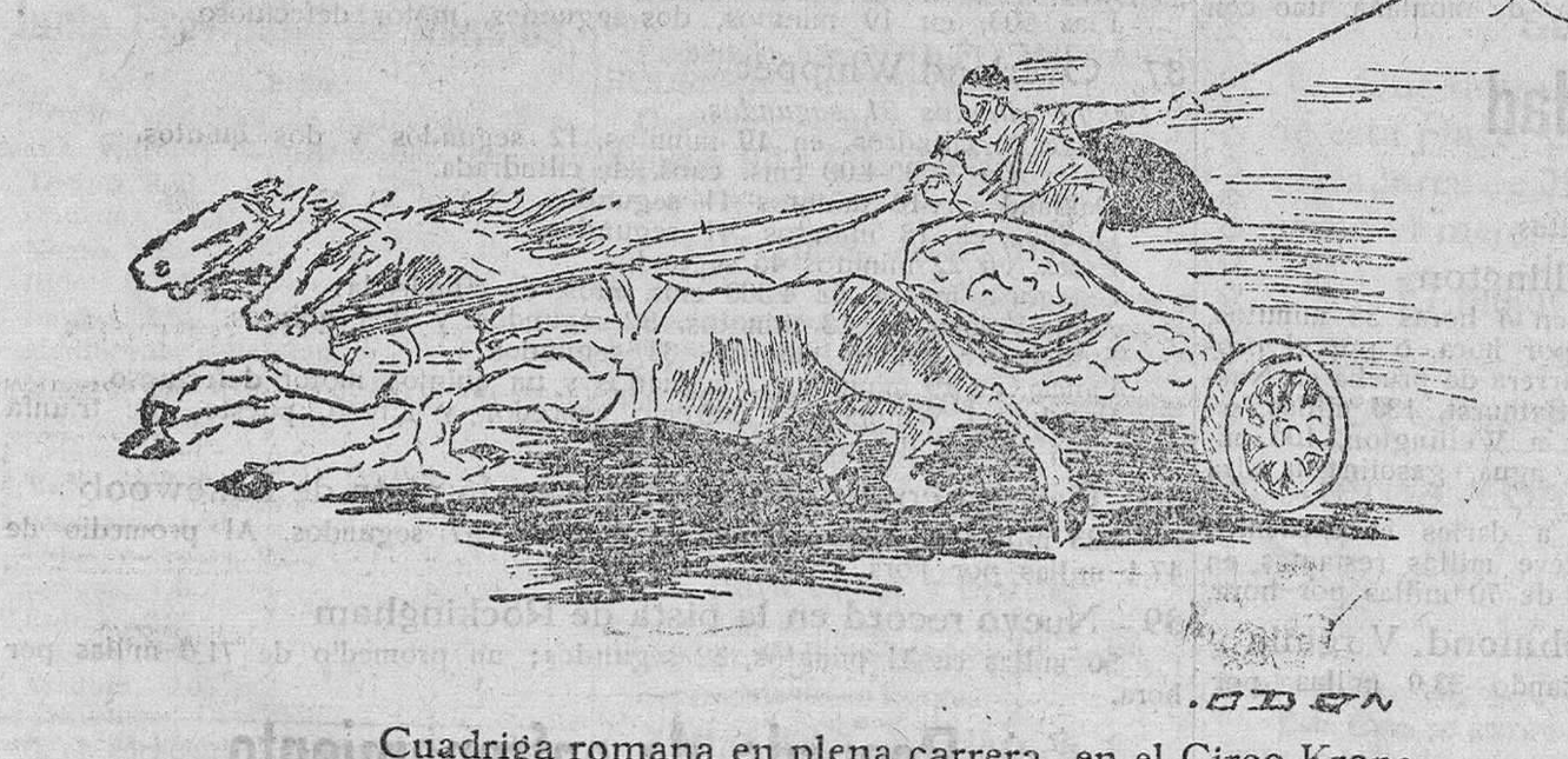
Cuadriga romana en plena carrera, en el Circo Krone.

No es propaganda Con hechos se demuestra que, para vestir con elegancia, en la Sastrería de Hurtado MARTINEZ DEL CAMPO, NUM. 1 Inmenso surtido en géneros con las más altas novedades