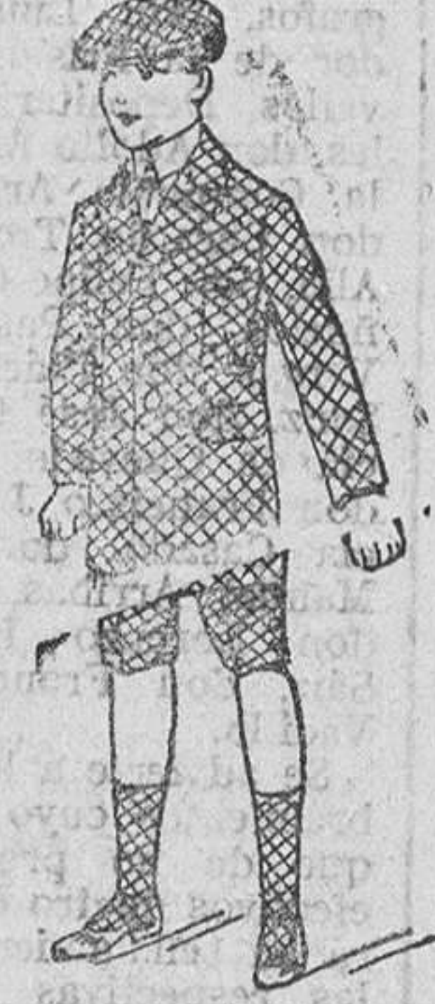
Trajecito cuadros, gran novedad, a 20, 25 y 30 pesetas