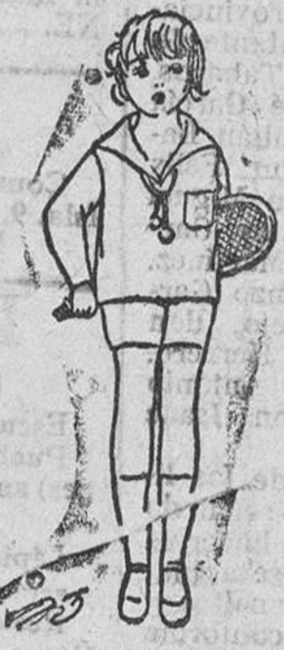
Trajecitos dril, en blanco y color, a 12, 15, 18 y 20 ptas.