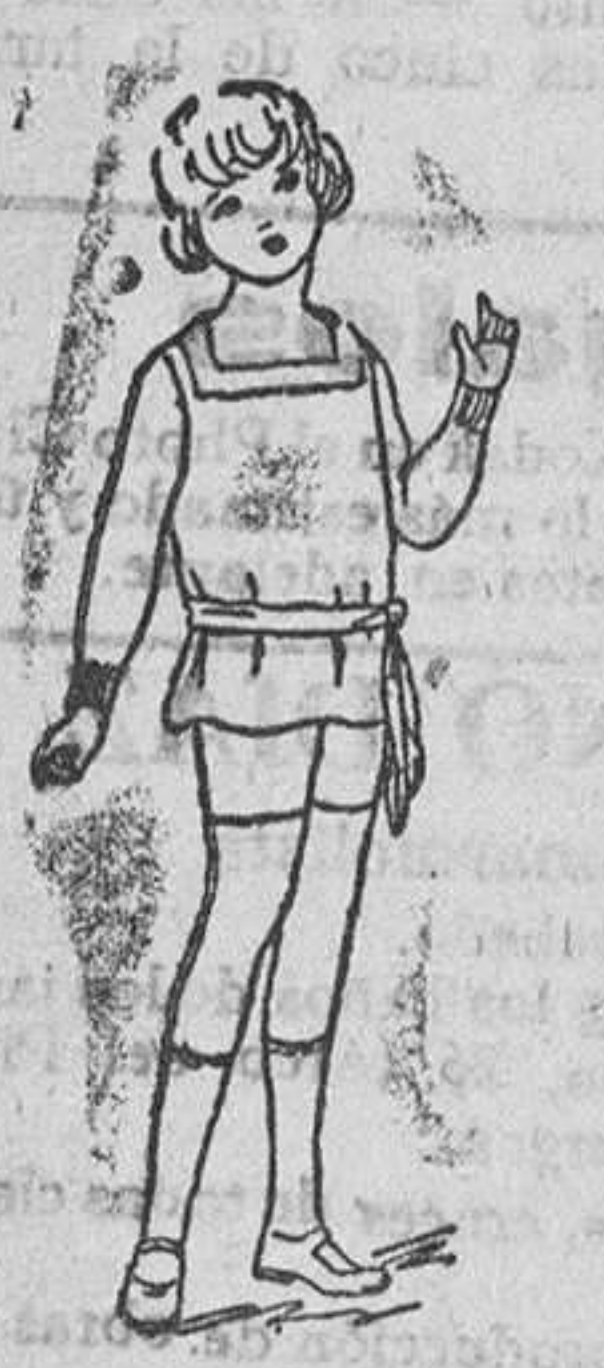
Trajecitos punto a 9, 10, 12 y 15 ptas.