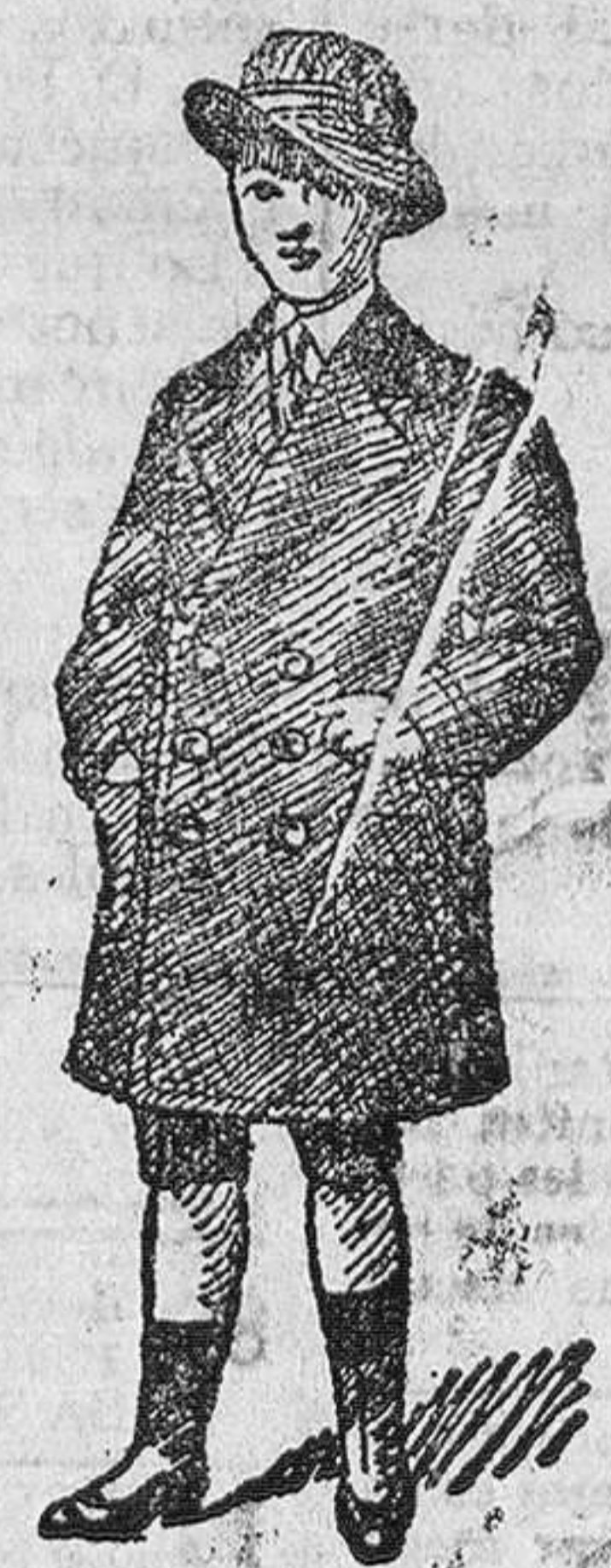
Abrigos de paño y de paño pluma, desde 15 a 50 pesetas.