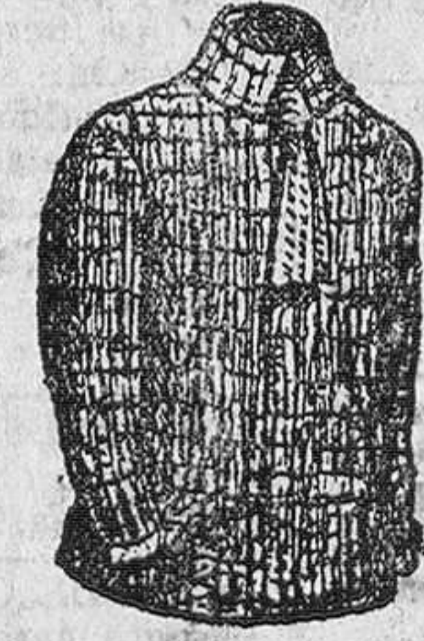
Cersy lana, a 9, 10, 12 y 15 pesetas. Cersy algodón, a 5, 6 y 7 pesetas.