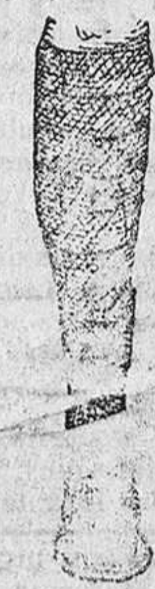
Bandas alpinistas, impermeabilizadas, a 5, 6 y 7 pesetas.