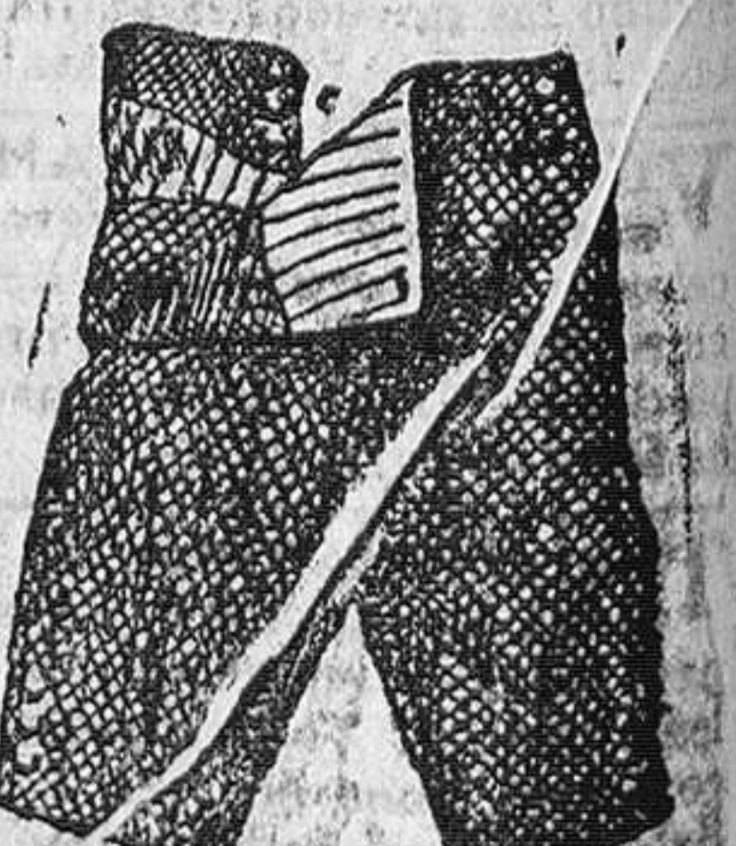
Pantalones sueltos, en pana, paño y patén, desde 3 a 7 pesetas.

Precio fijo verdad. Todos los artículos marcados.