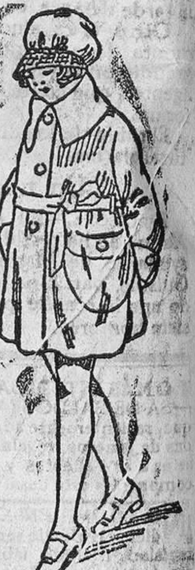
Abriguitos de g. muza para niñas, diversidad de modelos, de 5 a 50