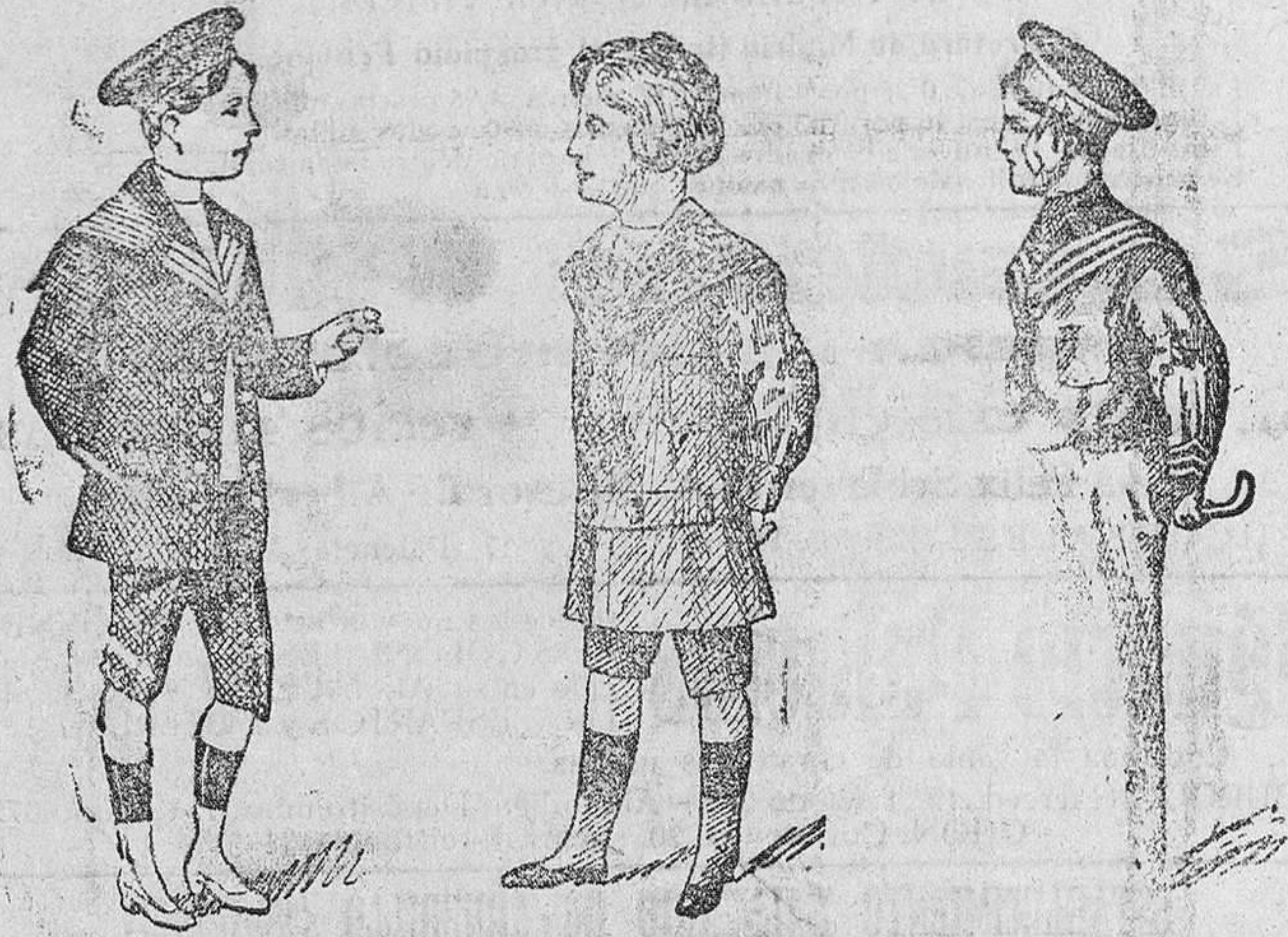
Sesenta modelos diferentes en trajecitos de dril, paño y pana, desde 8 á 50 pesetas

Gran casa de tejidos, pañería y confecciones de caballero, señora y niños