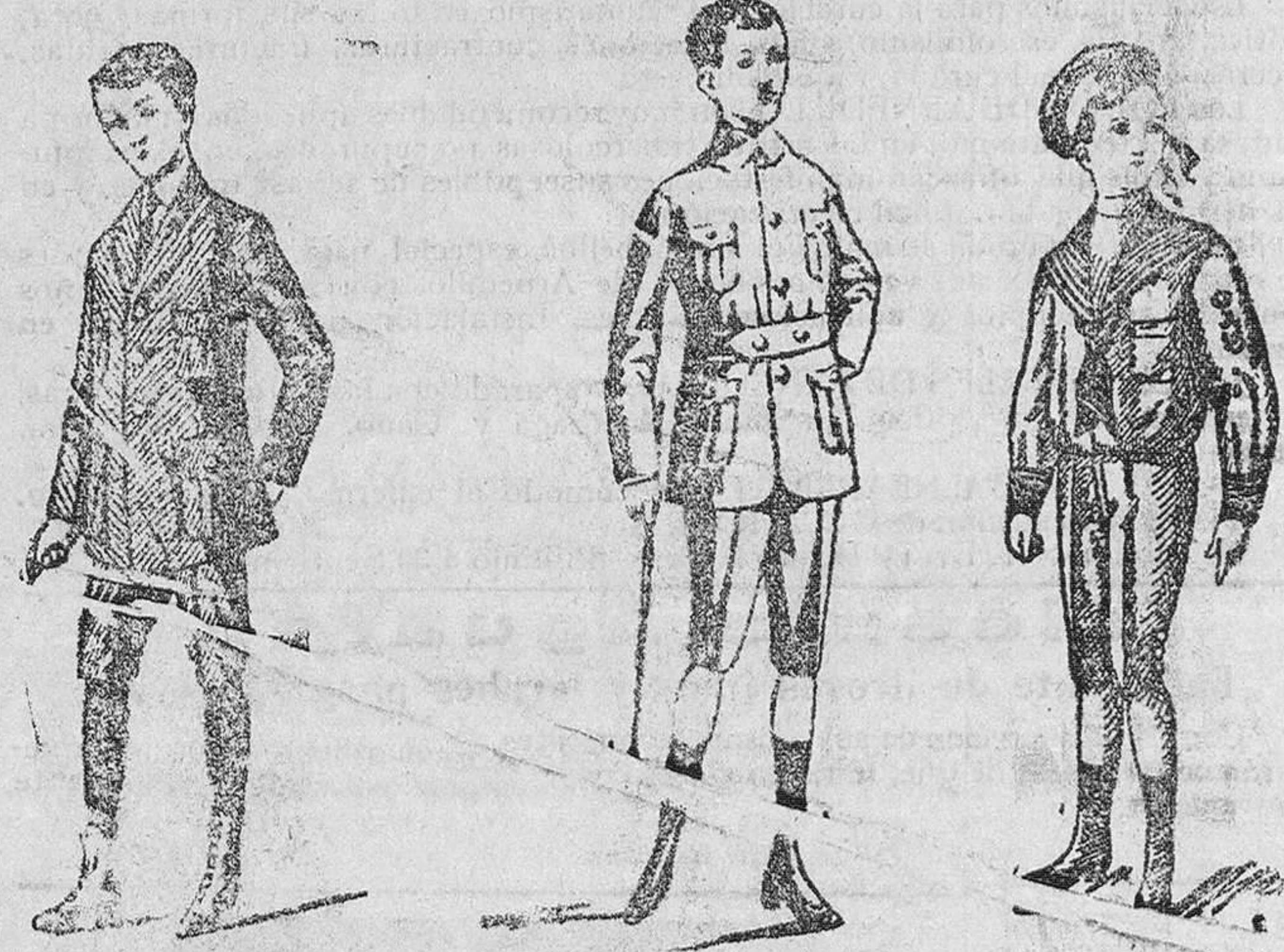
Trajes para jovencitos, en paño y dril, desde 20 á 70 pesetas