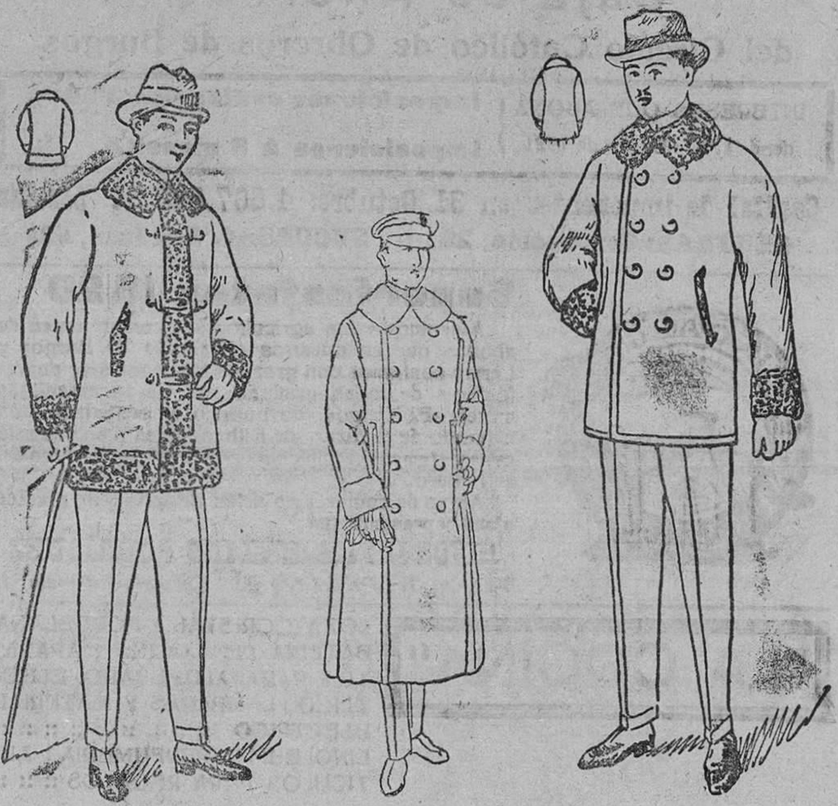
Pellizas paño castor, de rizo alrededor, desde pesetas 50 á 90. Guardapolvos de sofer, desde 20 á 30 ptas. uno. Pellizas paño melon, cuello y bocamangas rizo, desde 18 y 60 pesetas. m

CASA MUNGUÍA. (Sucesor de Rebollo) Plaza Mayor, 42, y Lala-Calvo, 9.-Teléfono núm. 88.-Burgos Primera casa en confecciones de esbalaro, señora, niños y niñas