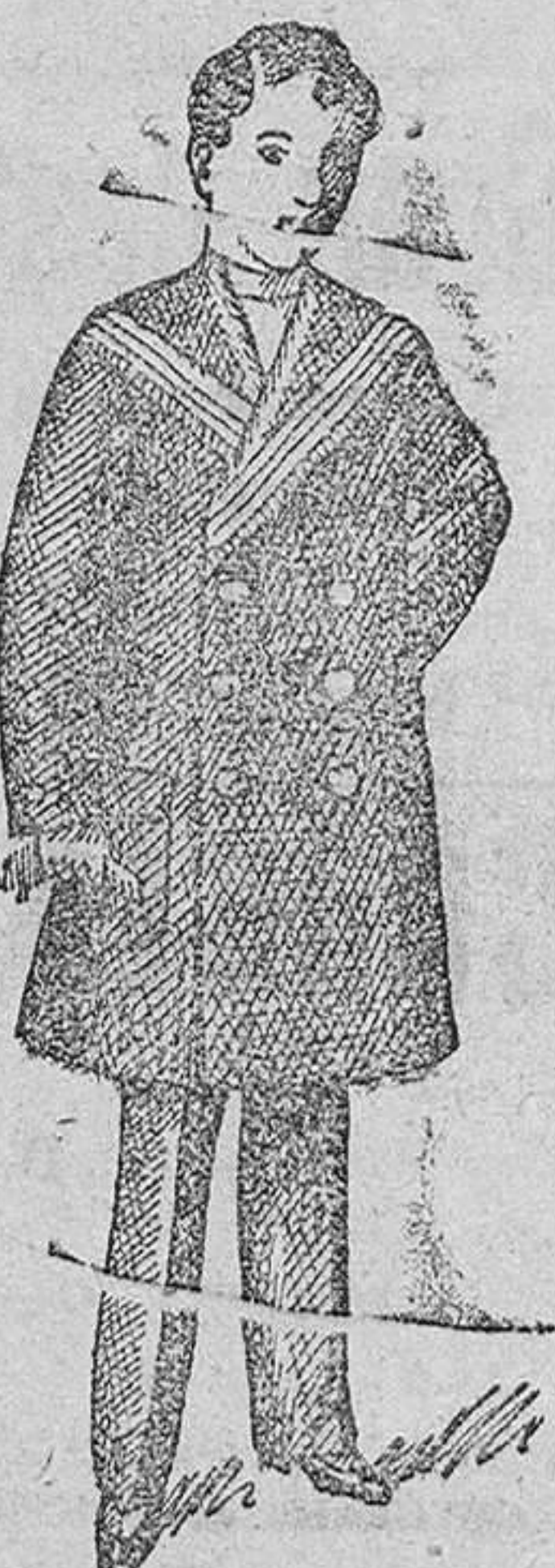
Mateos para niños, en vicuña azul y negro, desde 25 á 50 pts.