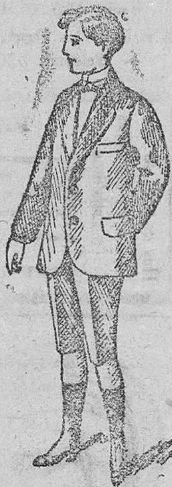
Trejechos para jóvenes desde 25 á 50 pesetas.