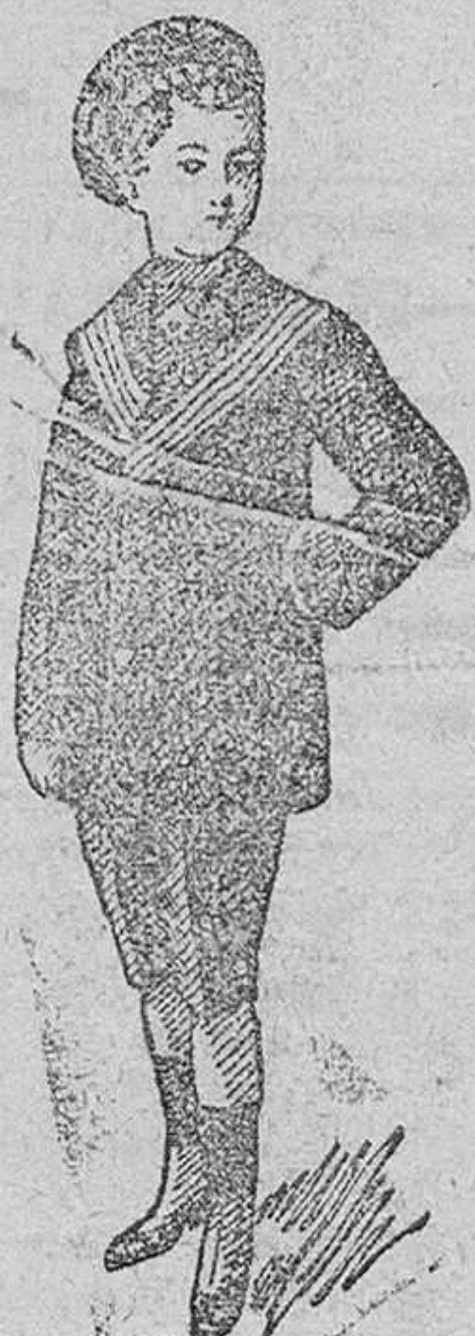
Trajes azules, cascaca, desde 20 á 35 pesetas.