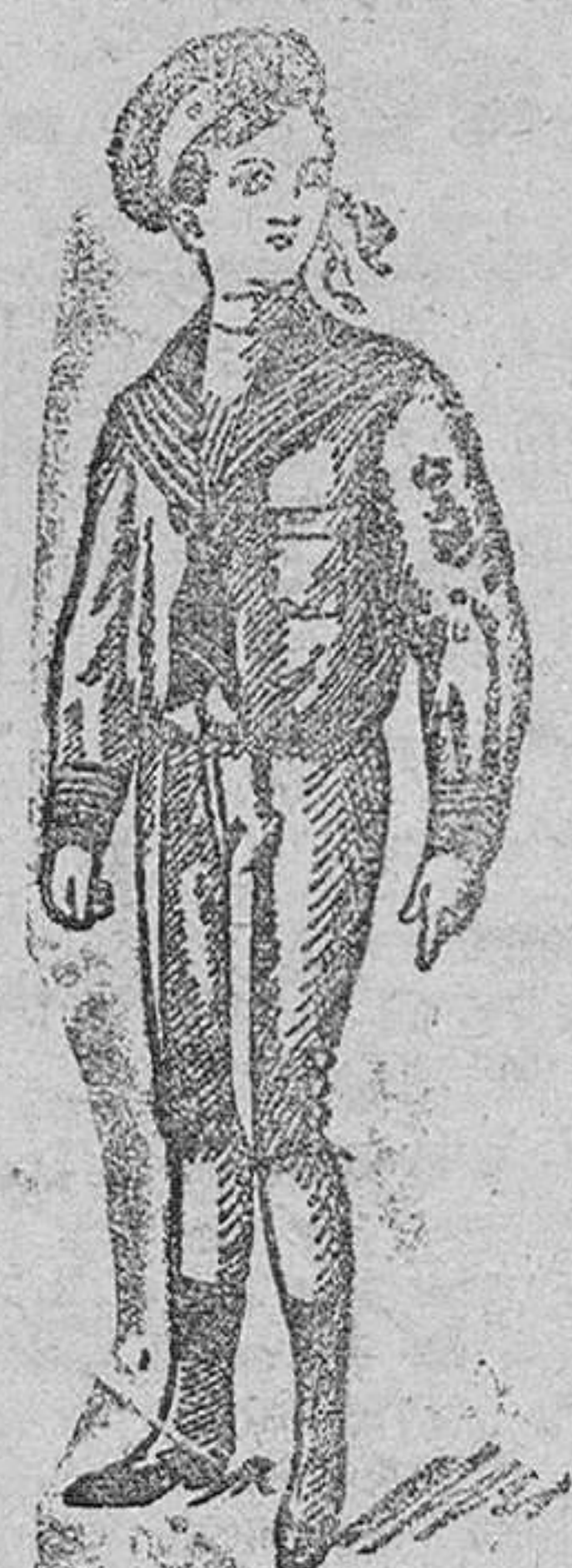
Trejechos vicuña azul á 15, 17 y 20 pesetas.

Primera casa en confecciones de caballero, señora, niños y niñas