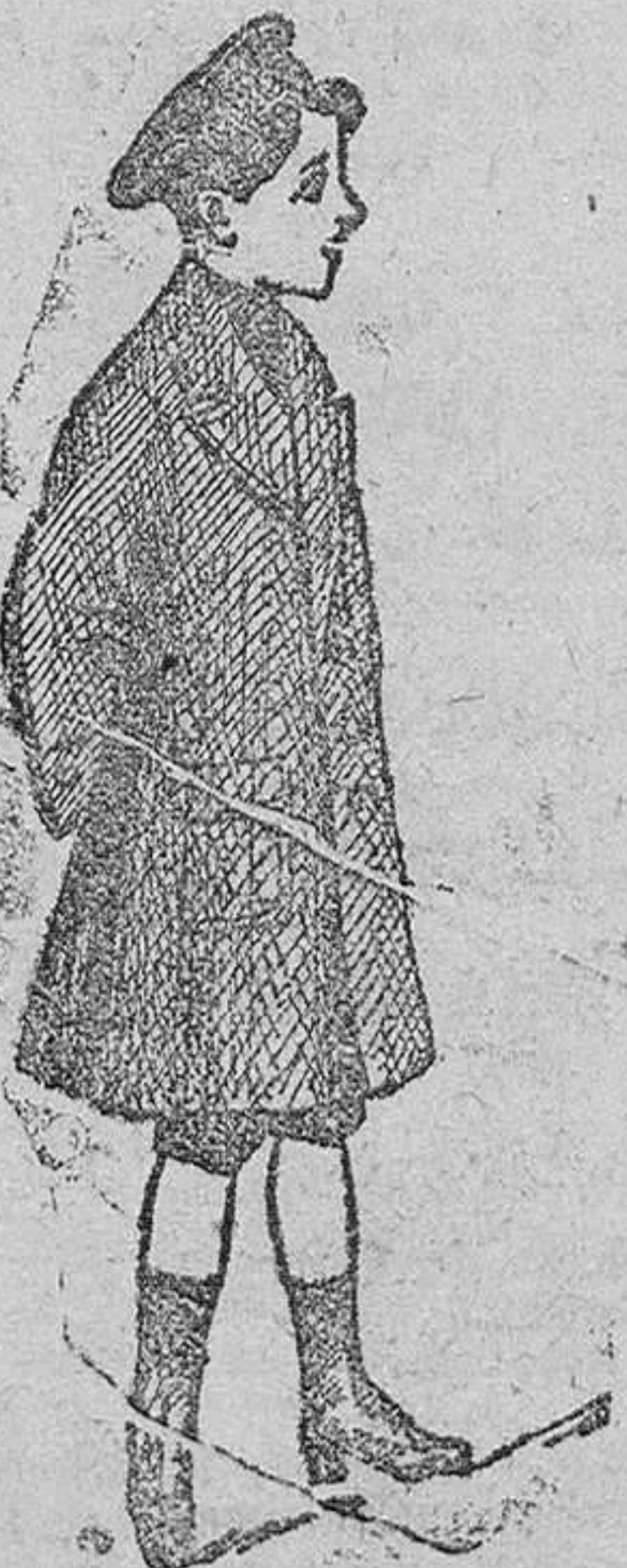
Abrigos de paño para niños, desde 20 á 50 pesetas.