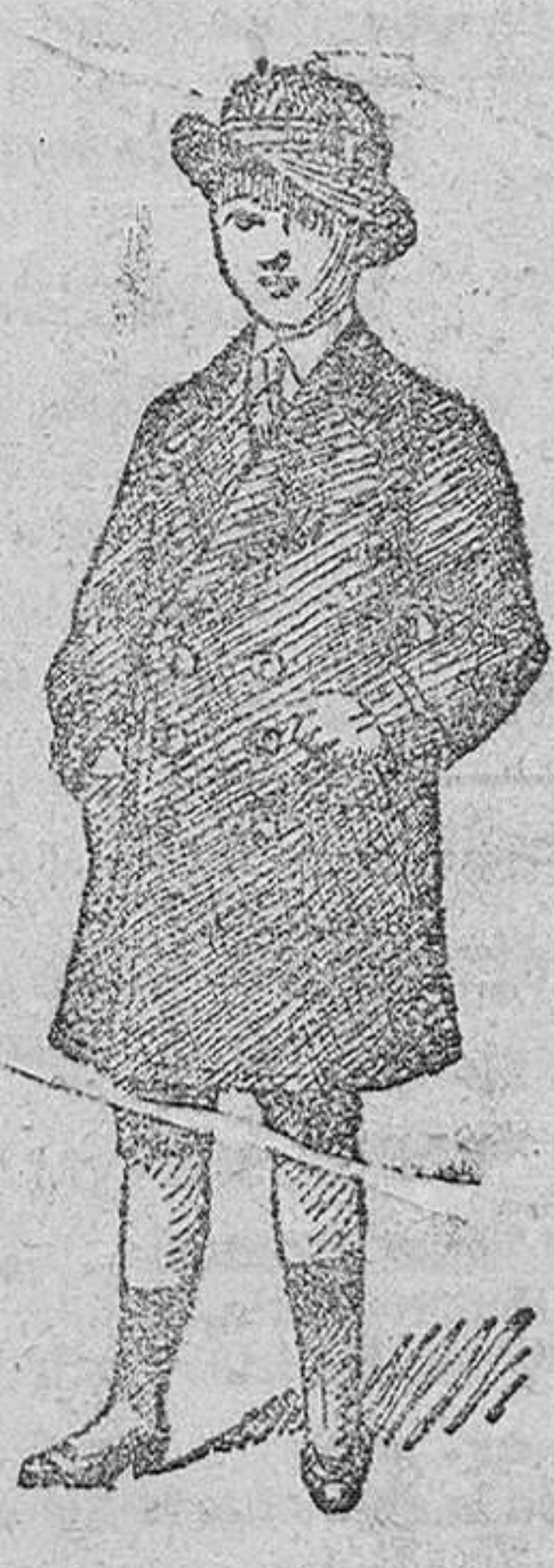
Gabancitos para jóvenes, forma novedad, desde 40 á 90 pesetas.