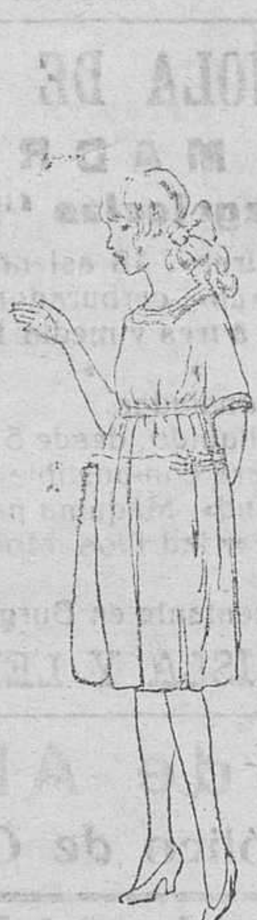
Vestidos niñas, edad 10 á 15 años, de 18 á 30 pts.