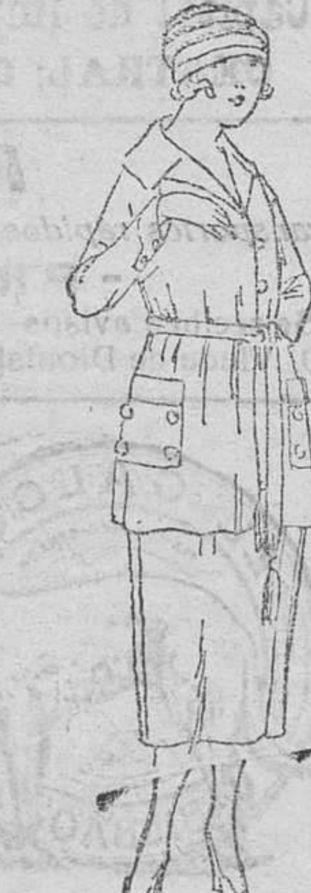
Traje levita en lana y algodón, negro y colores, de 50 á 120 pts.