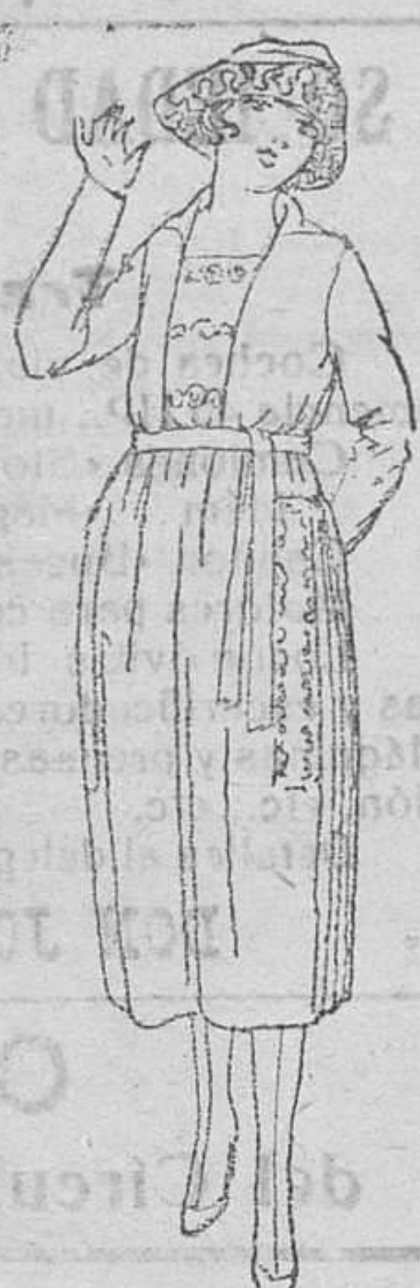
Vestidos sarga de algodón negro y colores, de 25 á 50 pts.