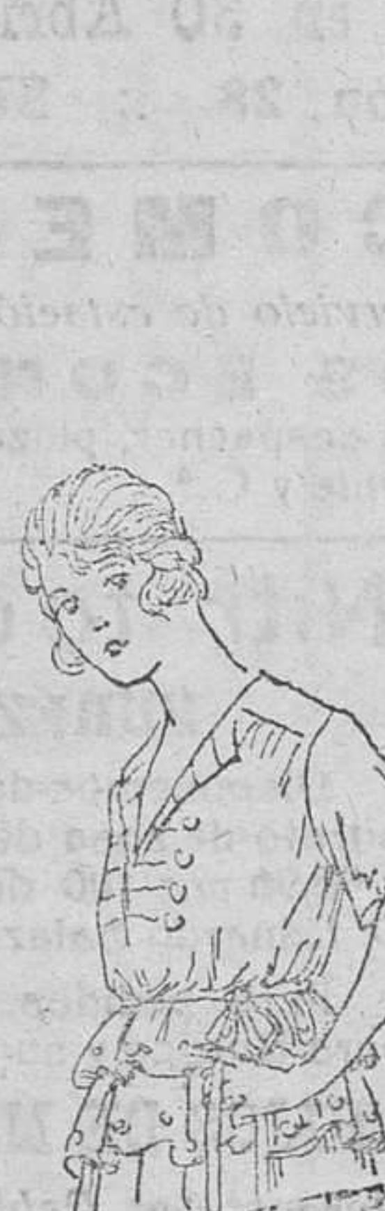
Blusas de punto doble, á 30, 35, 40 y 50 pesetas.