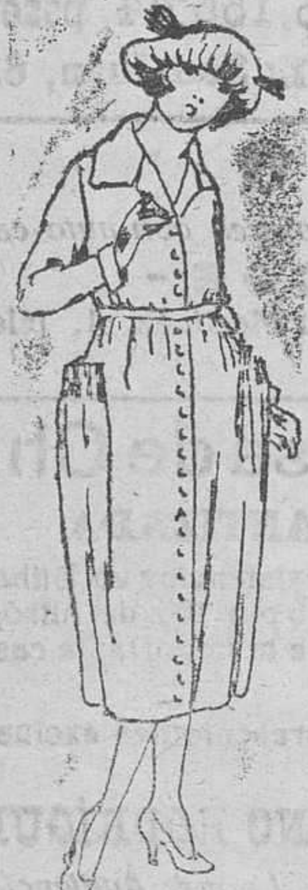
Vestido sarga inglesa estambre, etc. en azul y color, de 40 á 50 pesetas.