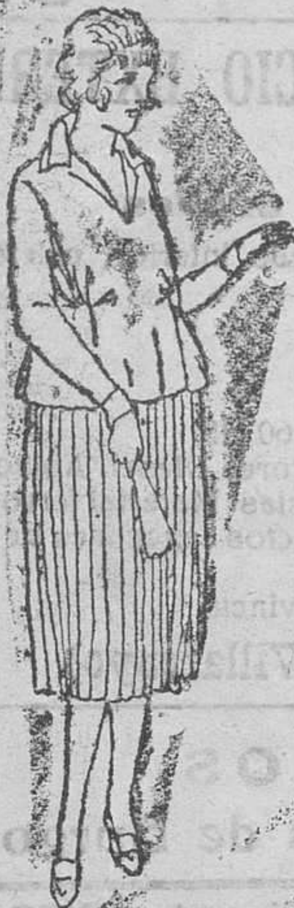
Faldas plisadas, de lana, á 25, 30 y 35 pesetas una.

Primera casa en confección de caballero, señora, niños y niñas