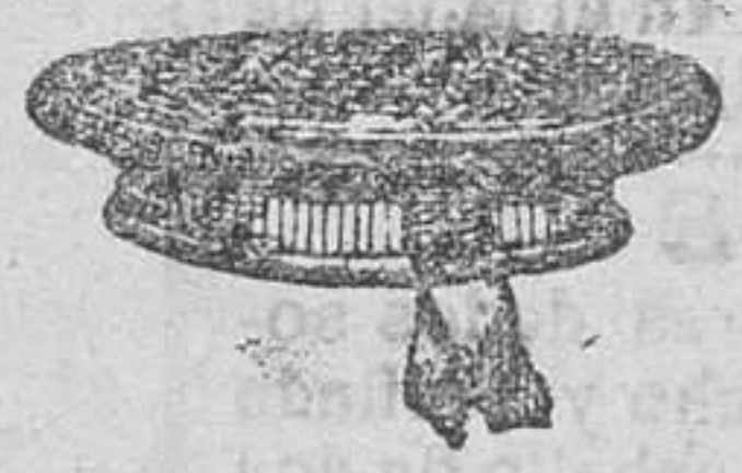
Gorritas de vicuña, en azul y color, á 2'50, 3 y 4 pesetas.