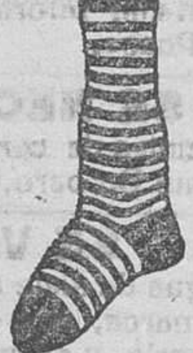
Calcetines de niño á 0'60, 0'70, 0'80, una peseta, 1'25 y 1'50.

Depósito de las sandalias «Paco», con piso de goma, propias para invierno, y de las máquinas de escribir NOISELESS, completamente silenciosas. VENTA DE LA CREMA SAPOLI, EL REY DE LOS BETUNES.