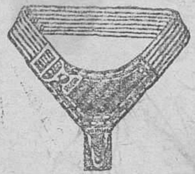
Ligas á 1'25 y 1'50; De cuero, 2 pesetas.