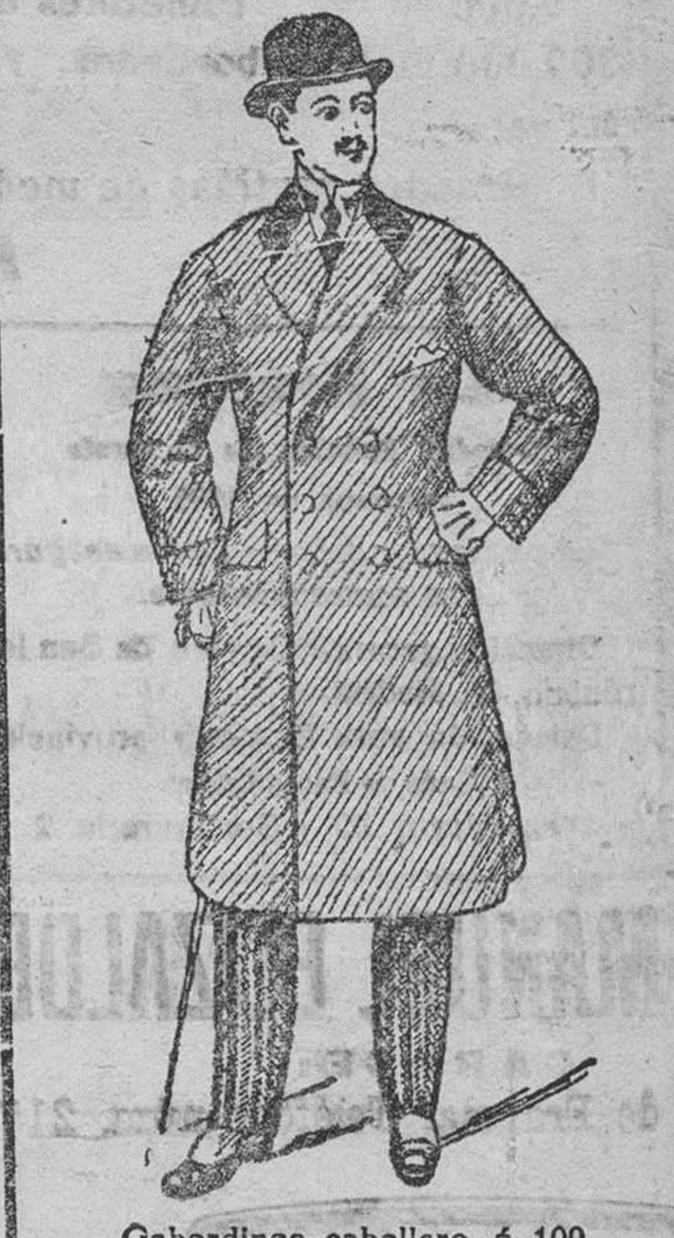
Gabardinas caballero, á 100, 115, 140 y 150 pesetas.

Casa Munguía Plaza Mayor, 42 y Lain-Calvo, 9 — BURGOS —