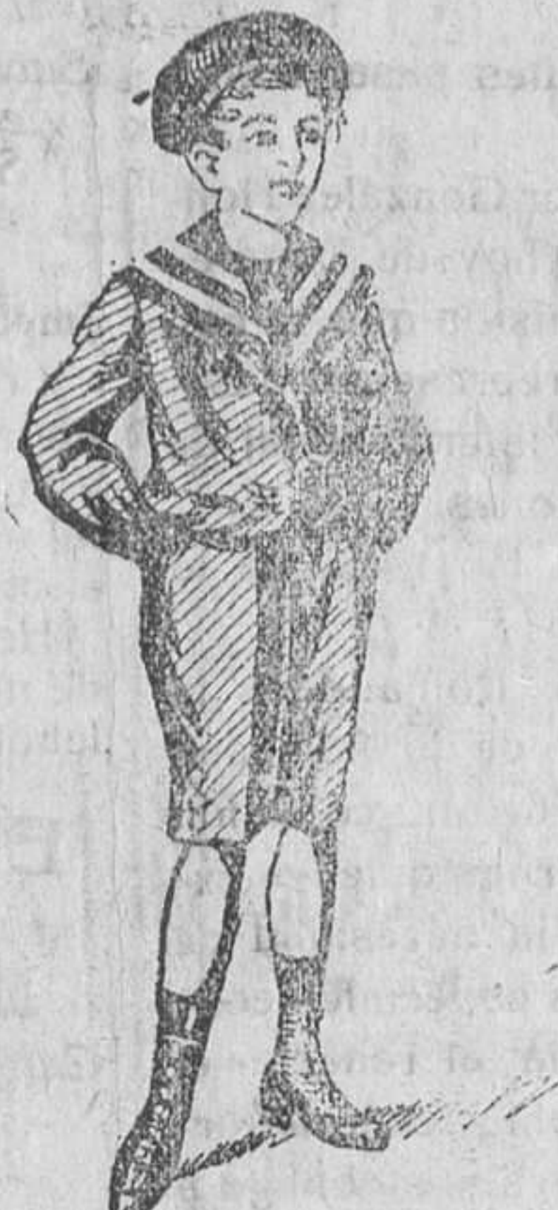
Trajecitos en paño, pana, gerga y drill

Abrigos niña, con cuello piel, á 15 y 25 pesetas.