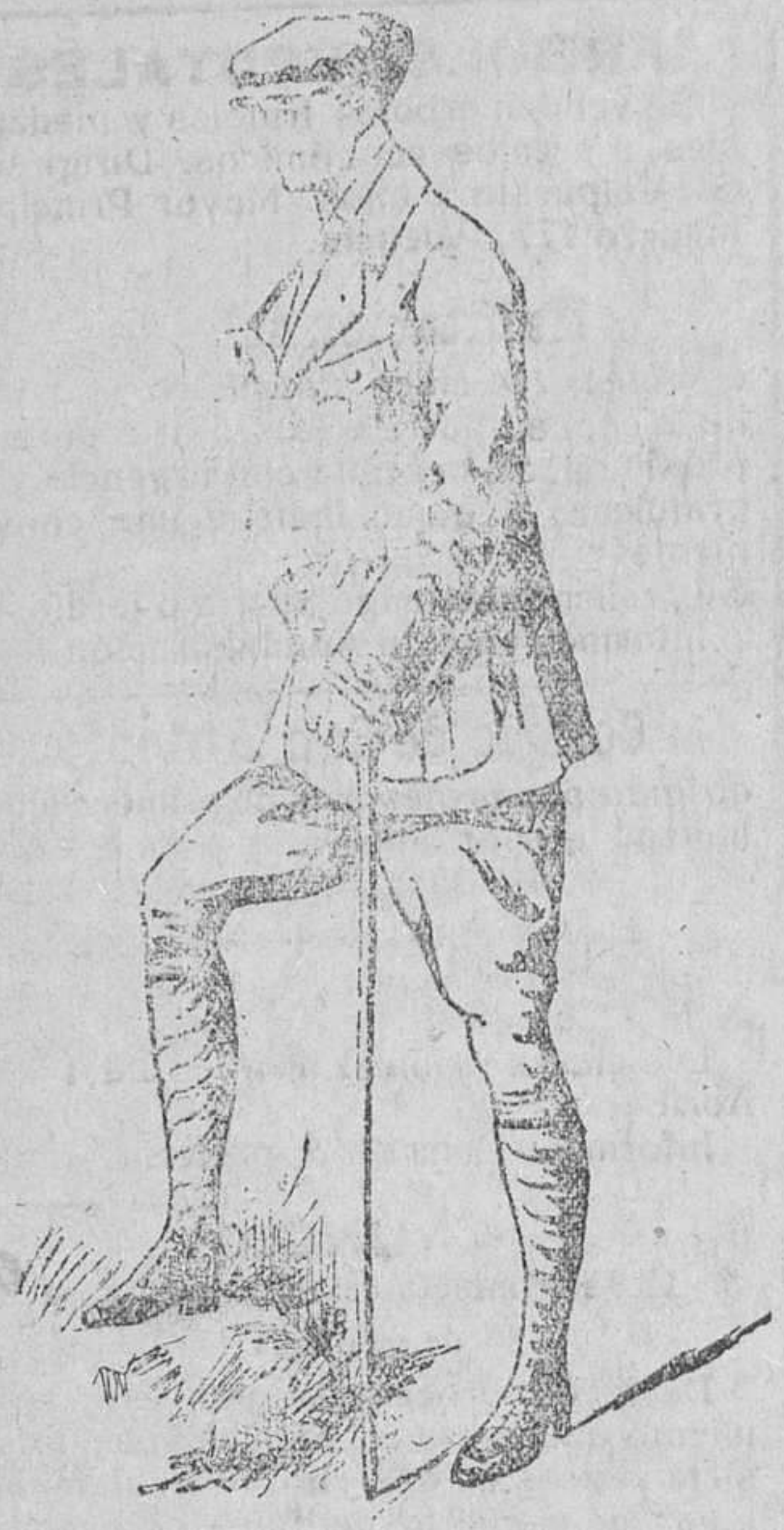
Traje sport, en paño y pana

Única casa que presenta grandes surtidos en tejidos y ropas confeccionadas de caballero, señora y niños