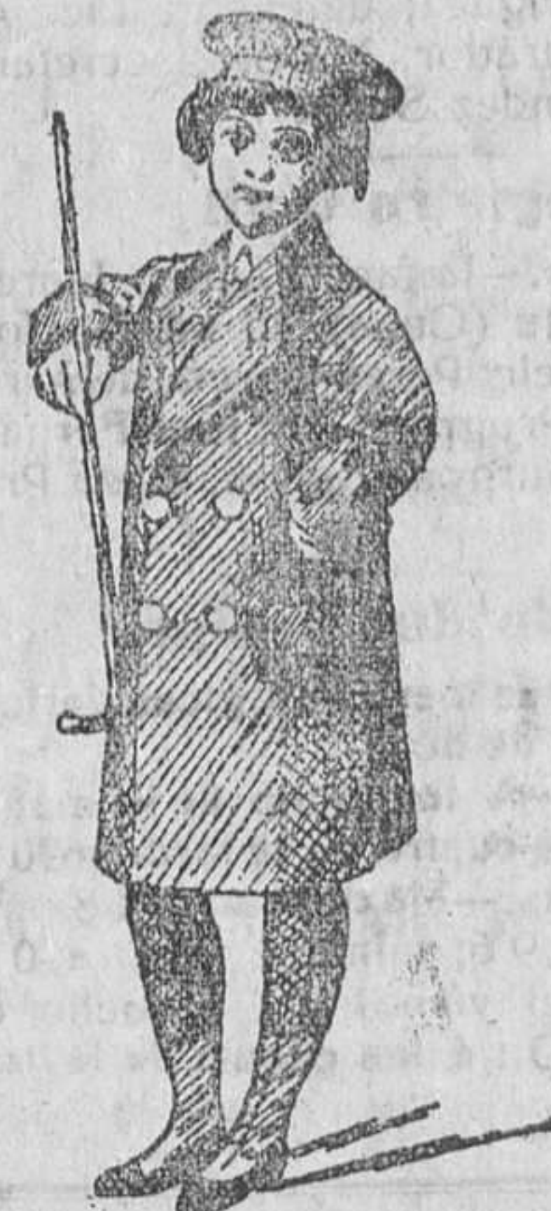
Matelos y gabancitos para niños, de ptas. 12 á 40.

50 modelos diferentes en trajecitos de paño y pana para niños.