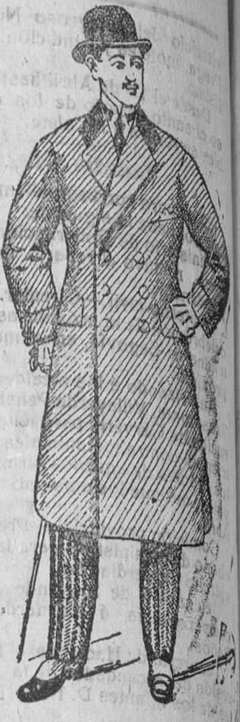
Gabanes desde pesetas 30 á 125

En forma entallada, hay seis modelos diferentes, á 80 ptas.