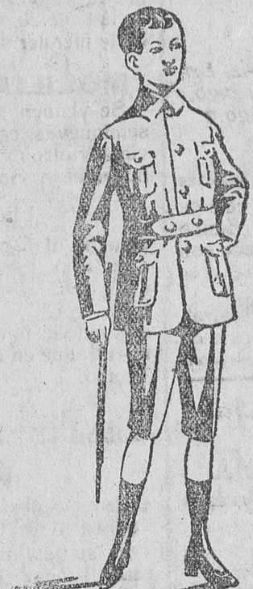
Trajecitos sport, en paño y pana

Trajes para jovencitos, en paño y pana, á precios muy baratos.