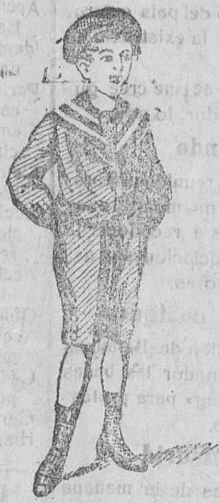
Trajecitos en paño, pana, gerga y drill