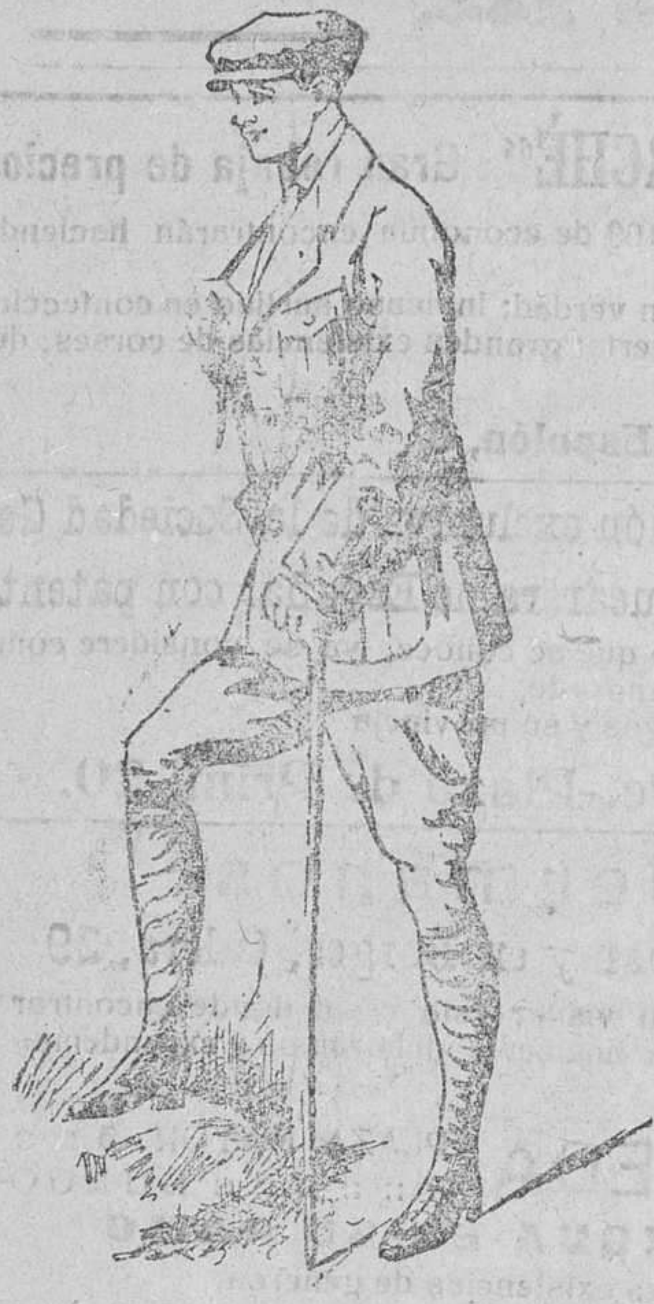
Traje sport, en paño y pana

Única casa que presenta grandes surtidos en tejidos y ropas confeccionadas de caballero, señora y niños