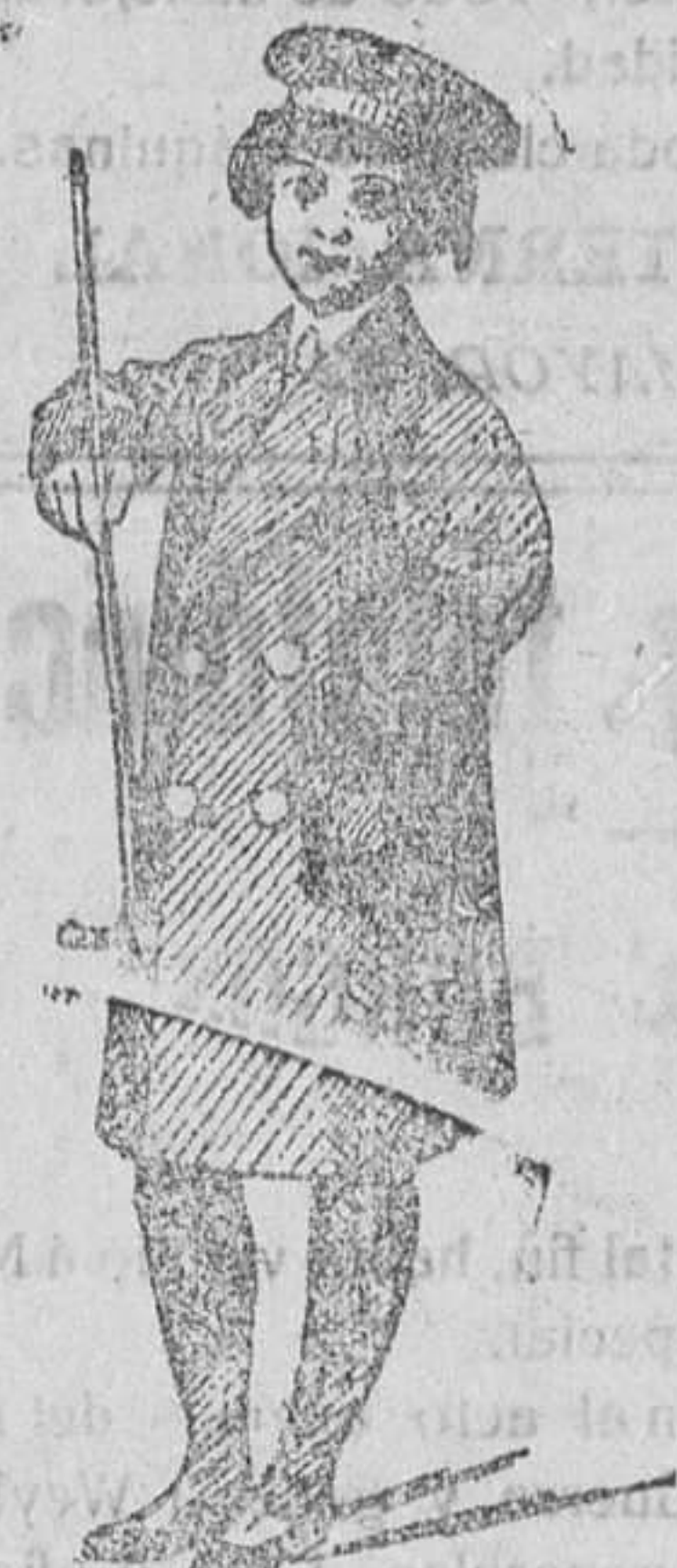
Mateos y gabancitos para niños, de ptas. 12 á 40.