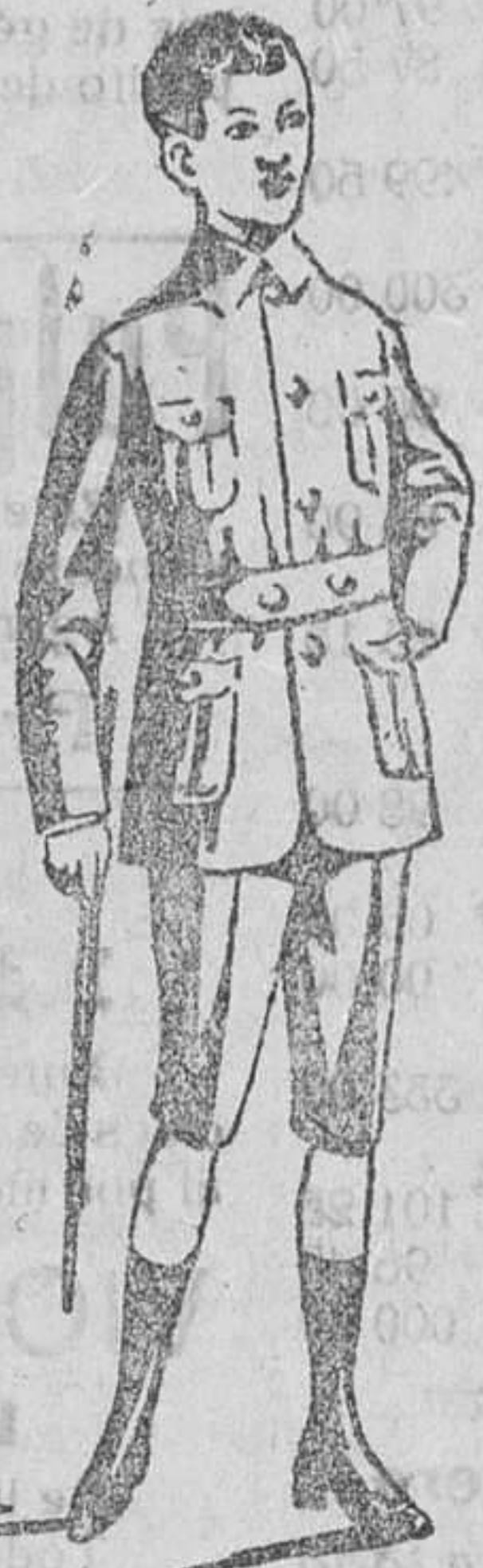
Trajecitos sport, en paño y pana