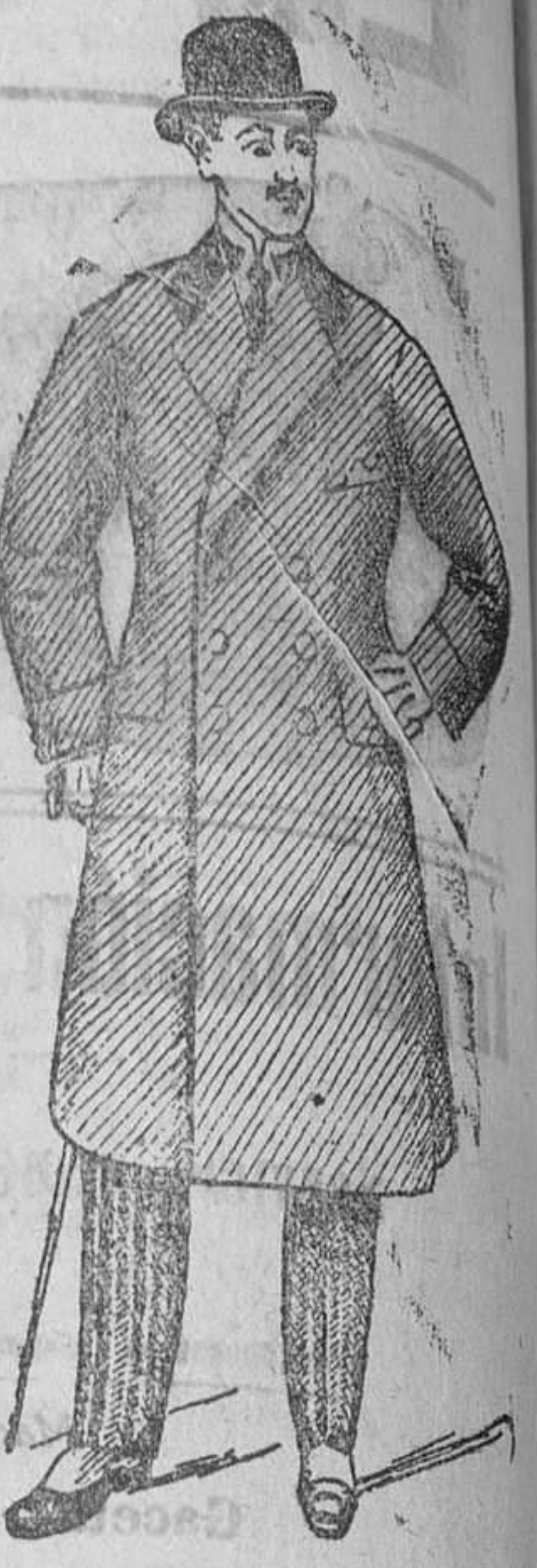
Gabanes desde pesetas 30 á 125

Trajes paño, caballero, de ptas. 20 á 90.