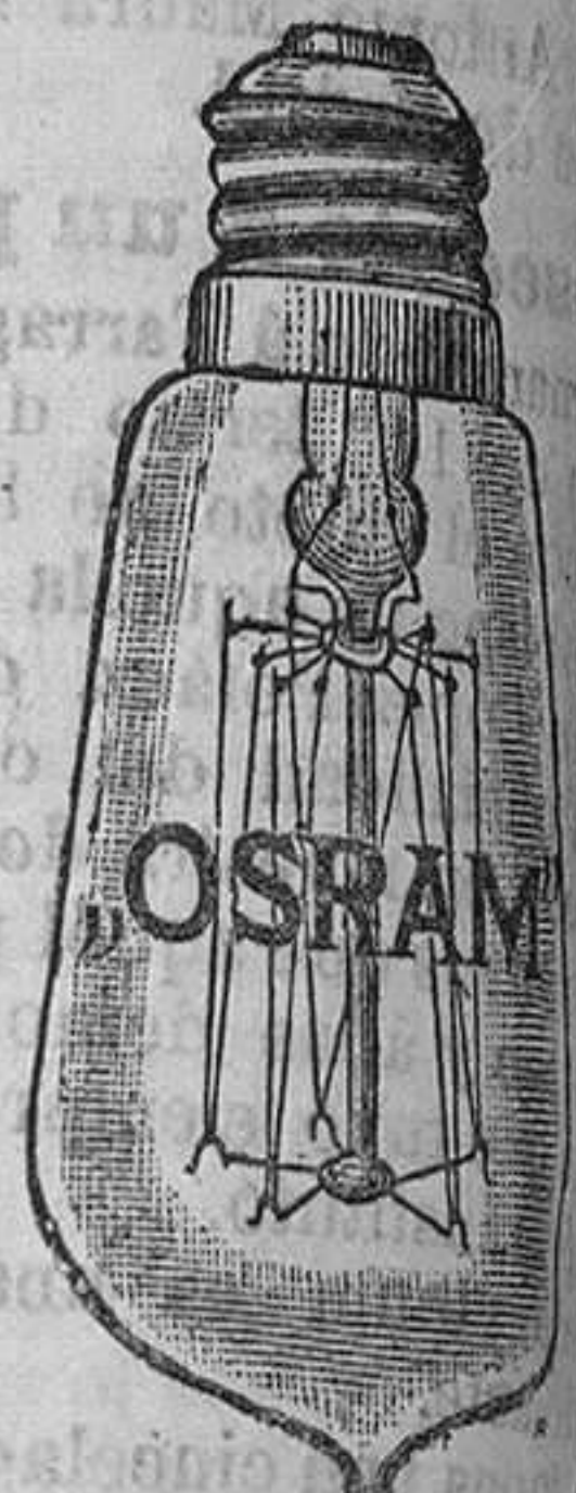
Toda lámpara «Osram» lleva la marca «OSRAM» grabada en el cristal.

LEON ORNSTEIN - Madrid - Mariana Pineda, 5