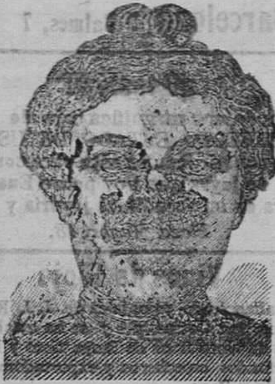
Antes de la curación.

Descubrimientos sensacional. Curación de las enfermedades de la piel y también de las llagas de las piernas