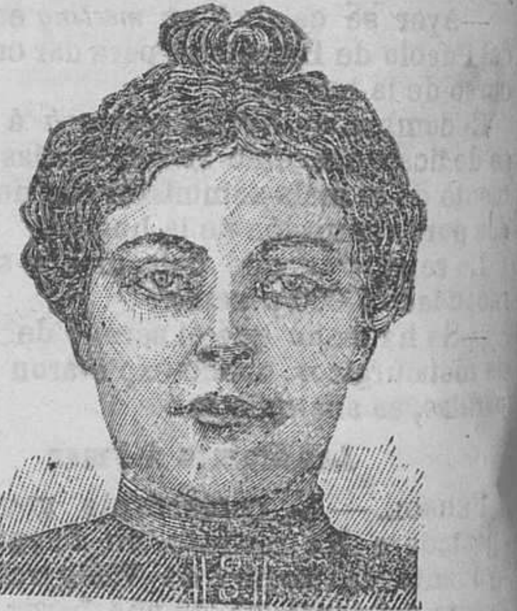
Después de 15 días de tratamiento.