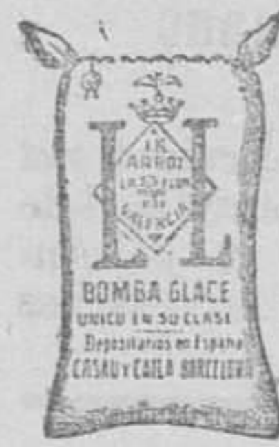
Arroz Glacé (1 Kilo)