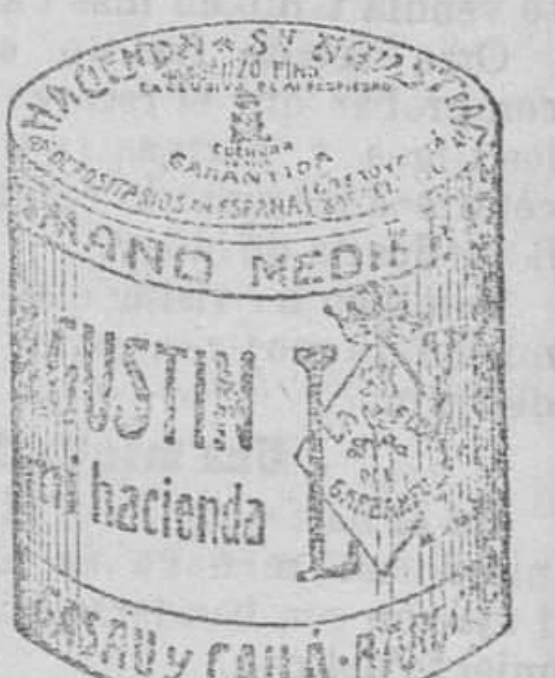
Garbanzo Sauce (5 Kilos)

Garantizamos al público que los comestibles empaquetados con nuestra marca son naturales de la planta, y sin contener la más pequeña adulteración en beneficio de ellos ni para hermosearlos, por lo cual nos hacemos responsables á todo análisis que quiera efectuarse.