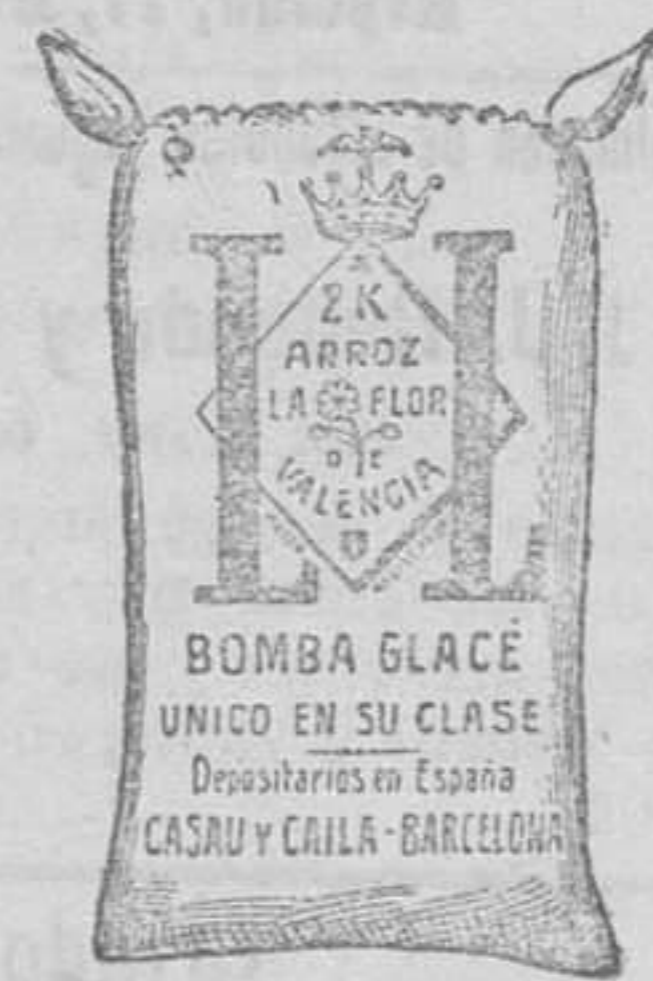
Arroz Glacé (2 Kilos)