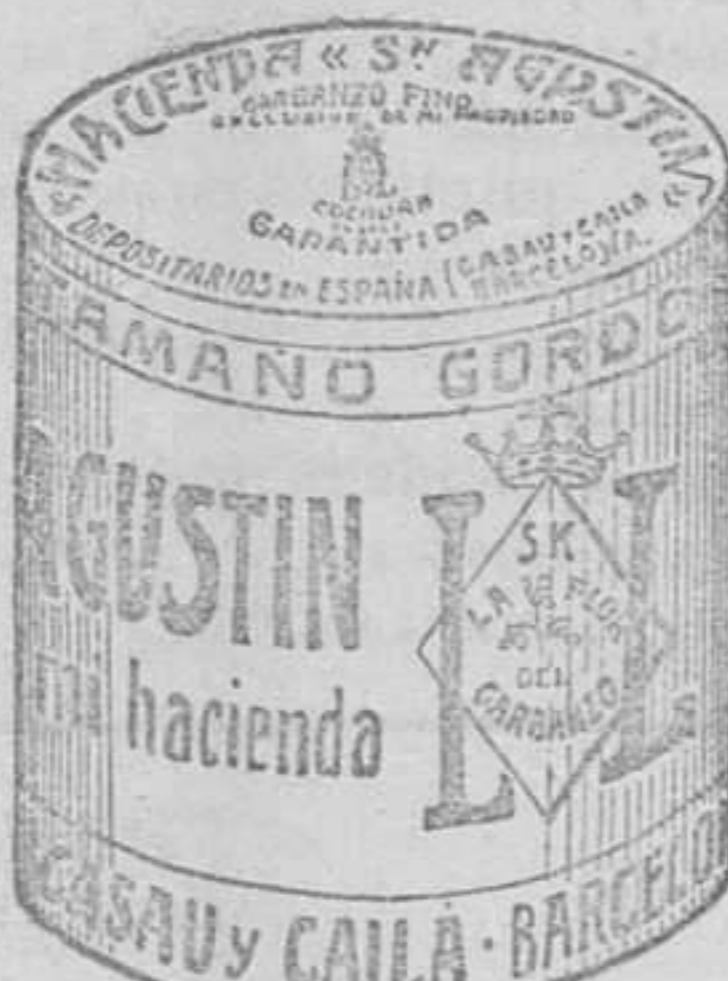
Garbanzo Sauce (5 Kilos)

Pedid el CAFÉ de FAMILIA que es uno de los grandes éxitos de la casa, por su calidad y baratura.