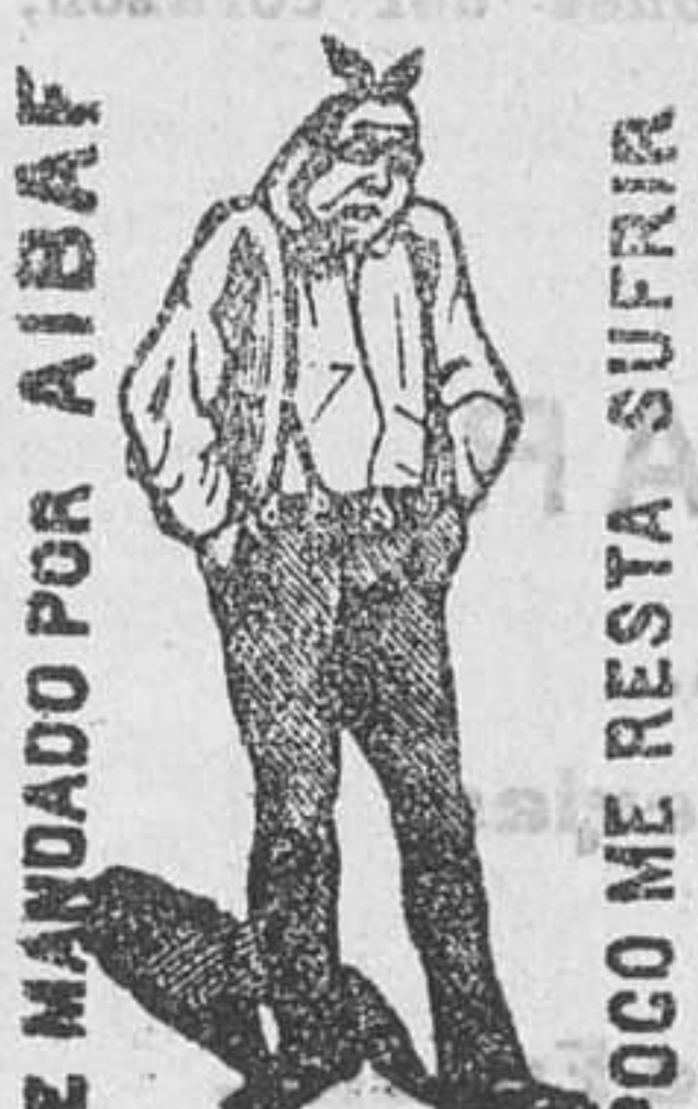
HE MANDADO POR AIBAF POCO ME RESTA SUFRIR