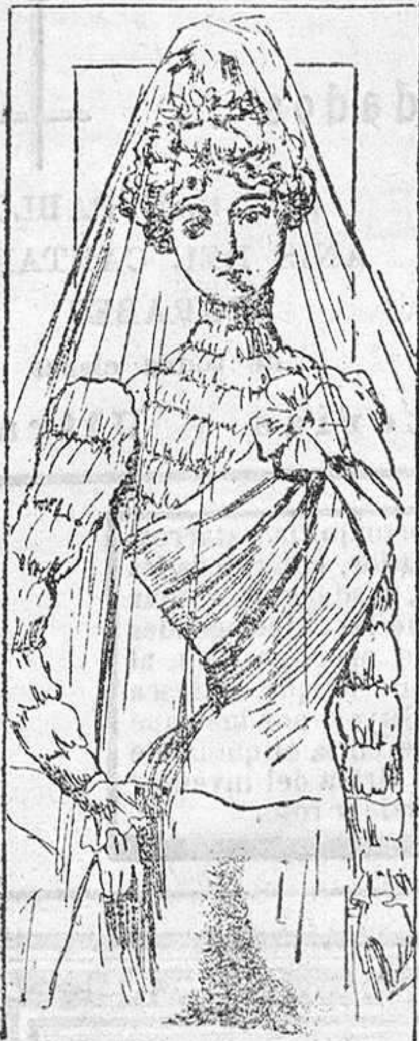
Traje para novia

Modelos exclusivos para nuestras lectoras de los grandes almacenes de EL SIGLO, Barcelona.