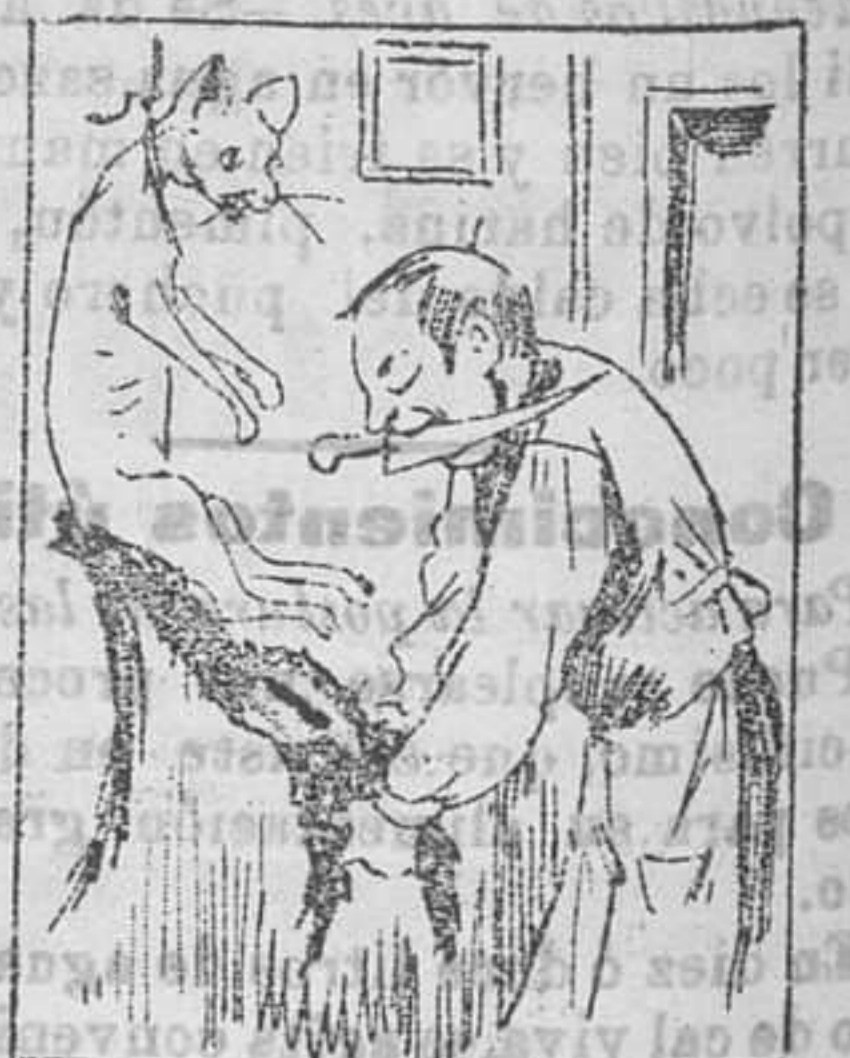
Solución a la charada: