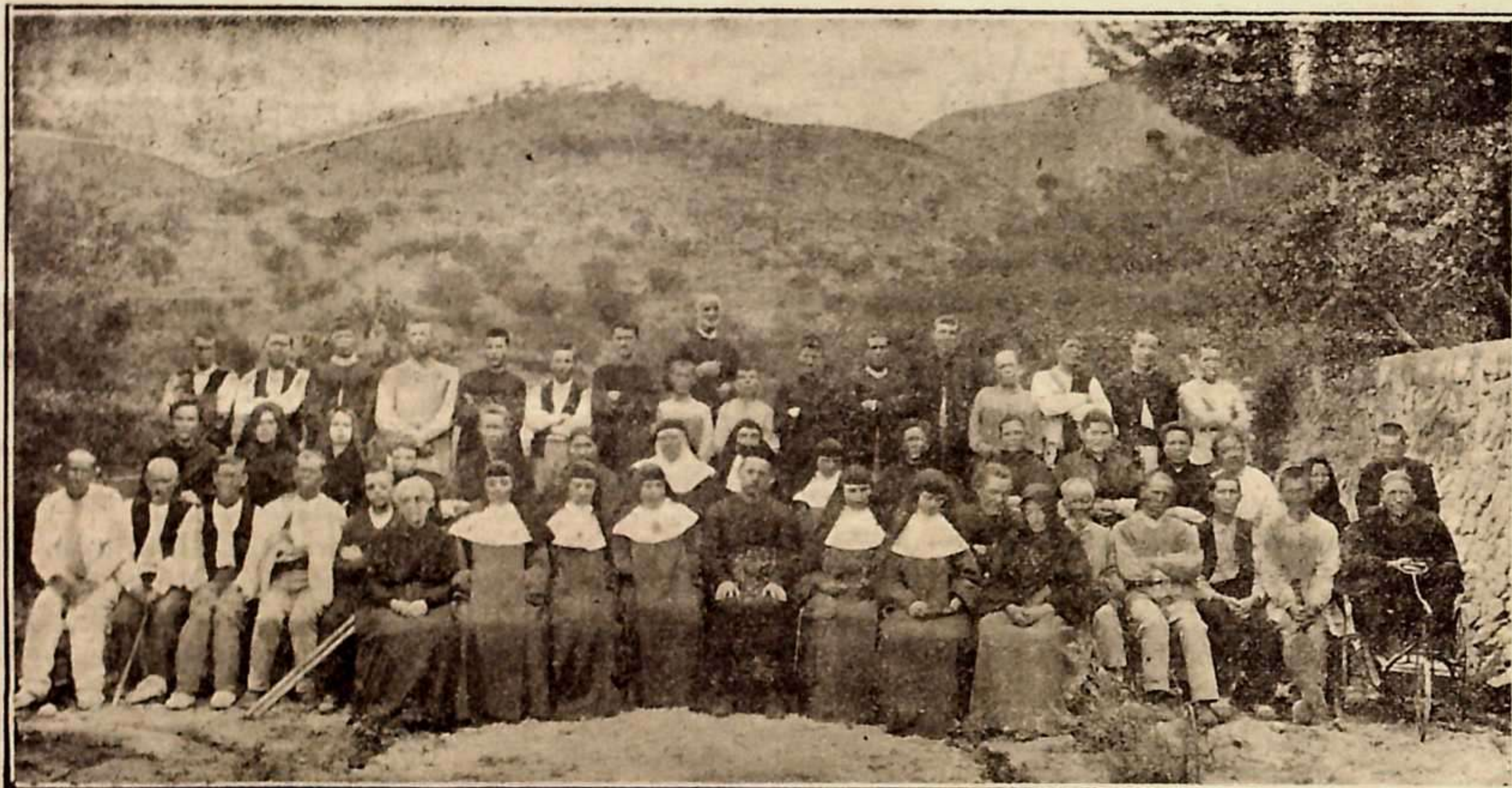
Grupo de leprosos, que con admirable fruto espiritual practicaron los Santos Ejercicios.