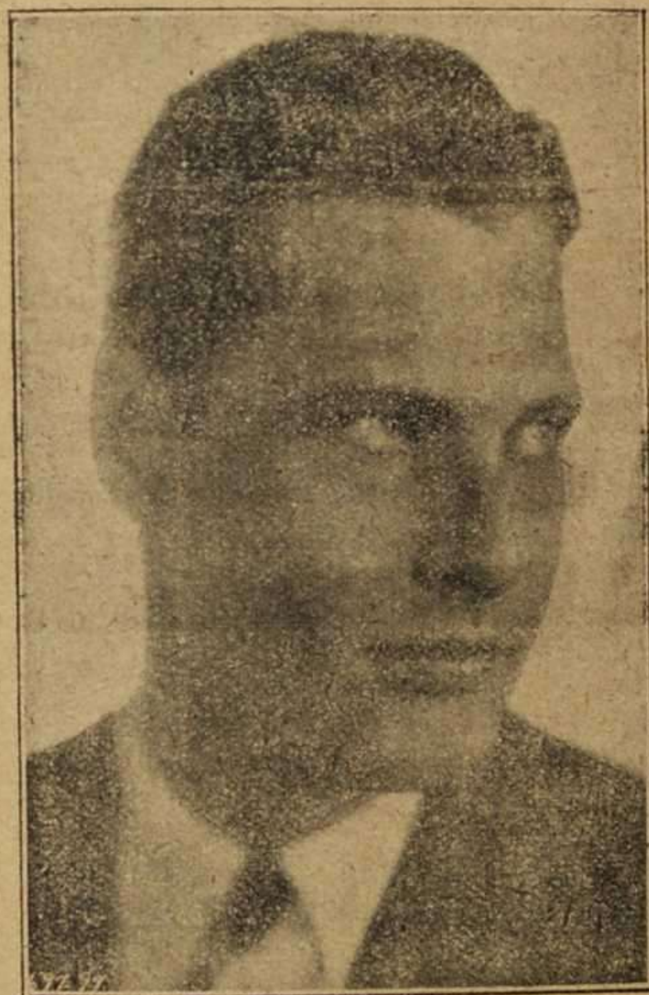
Richard Arlen en "El Hombre que amo"