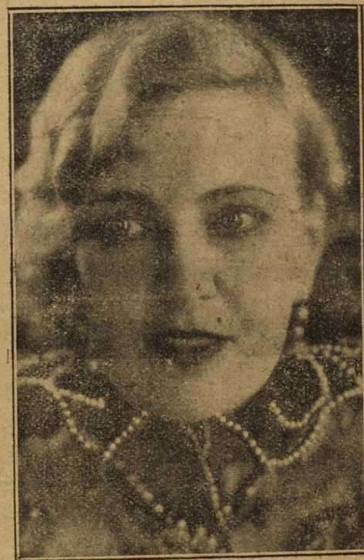
Olga Baclanova en Los muelles de New York