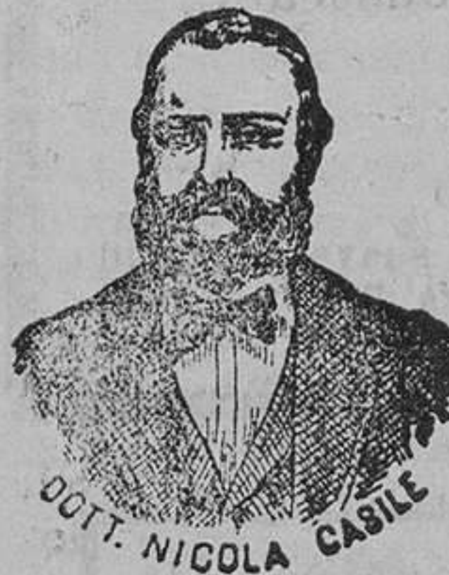
INVENTOR DE LOS RENOMBRADOS MEDICAMENTOS CASILE

Lo que no solo cura prodigiosamente todas las enfermedades del estómago, como son atonía (debilidad de estómago), digestiones laboriosas ó difíciles, proisís ó acedias, inapetencia, gastralgias, dilatación, catarros, úlceras, hipercloridria y toda clase de dispepsias haciendo desaparecer al momento los vómitos, ardores y pesadez, sino que se recomienda como indispensable y de necesidad para todos los convalecientes de cualquier enfermedad.