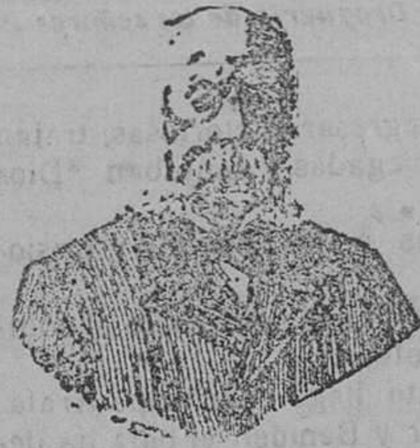
A. CHARLES LAMBERT

Precios de venta: Perlas Casile, 5 ptas. Confites Casile, 5 ptas., Balsamo Casile, 5 ptas. De venta en las acreditadas farmacias y en casa del inventor Diputación 435, Barcelona. En San- tander en la del doctor Crispulo Ordoñez, calle del Martillo.