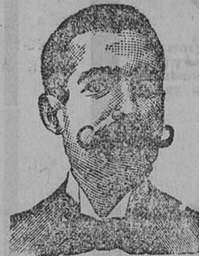
Inventor de los renombrados medicamentos COSTANZI Calle Diputación 435 BARCELONA

Roob Antisifilítico Inyección Vegetal COSTANZI