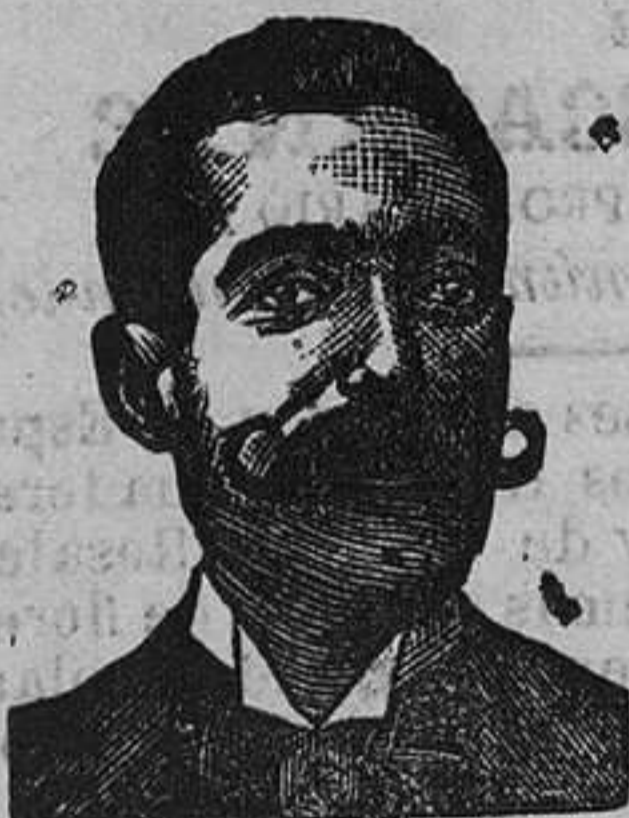
A. SALVATI COSTANZI Calle Diputación, 435 BARCELONA

en todos los Cafés, Casinos, Círculos, Fondas, Hoteles y Restaurants, exigiendo las etiquetas una, dos, tres copas extra y fundador con su escudo de armas.