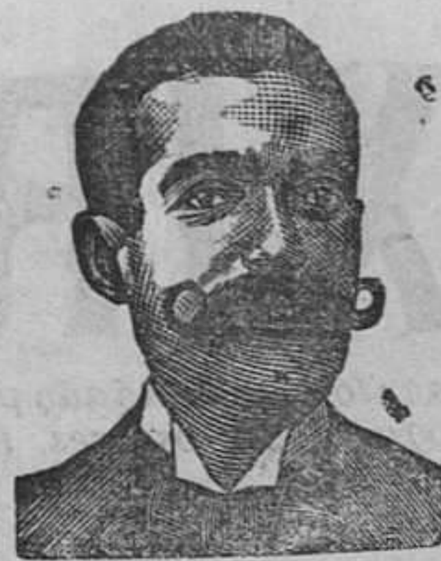
A. SALVATI COSTANZI Calle Diputación, 435 BARCELONA

Esta se expende en el Gabinete Electro-terápico, Carretas, 19, pral., Madrid , adonde los enfermos crónicos encuentran constantemente, de 9 á 12 y de 2 á 6, médicos especialistas que pueden consultar y ser registrados gratuitamente. Los de provincias pueden hacerlo por correo.