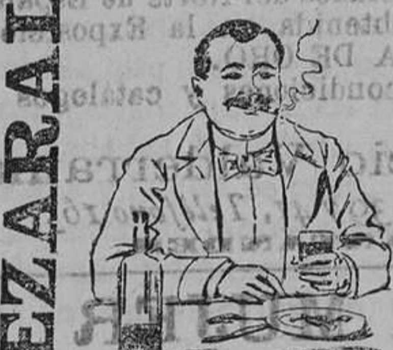
Efectos de haber tomado el QUEZARAL