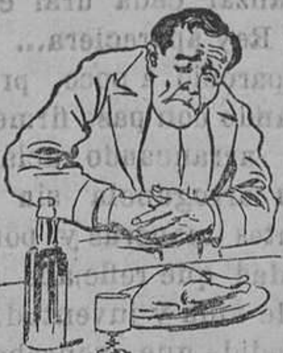
Causas de no tomar el QUEZARAL