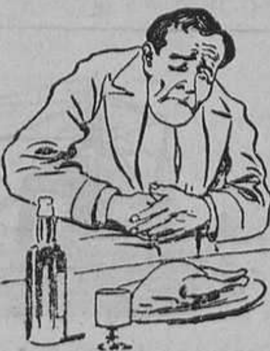
Causas de no tomar el QUEZARAL