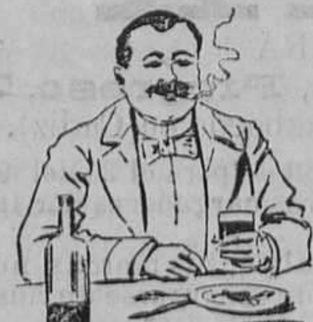
Efectos de haber tomado el QUEZARAL