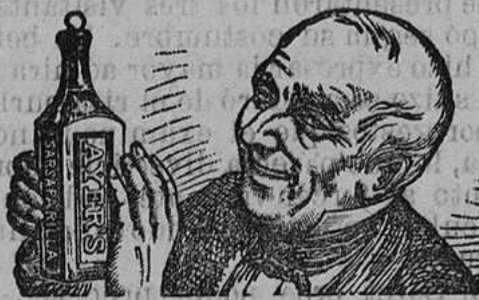
EL EXTRACTO COMPUESTO DE