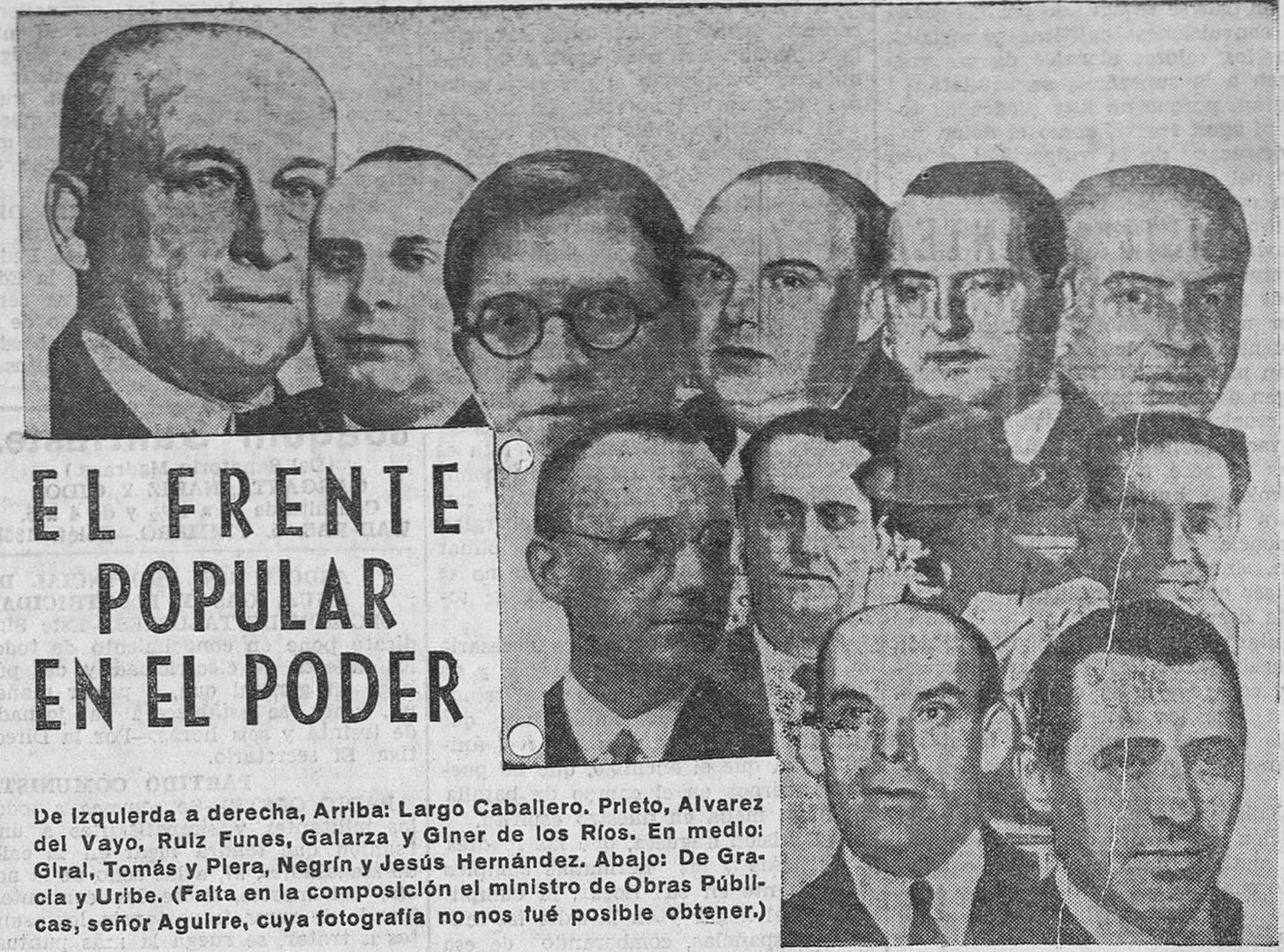
De izquierda a derecha, Arriba: Largo Caballero, Prieto, Alvarez del Vayo, Ruiz Funes, Galarza y Giner de los Ríos. En medio: Giral, Tomás y Plera, Negrín y Jesús Hernández. Abajo: De Gracia y Uribe. (Falta en la composición el ministro de Obras Públicas, señor Aguirre, cuya fotografía no nos fué posible obtener.)