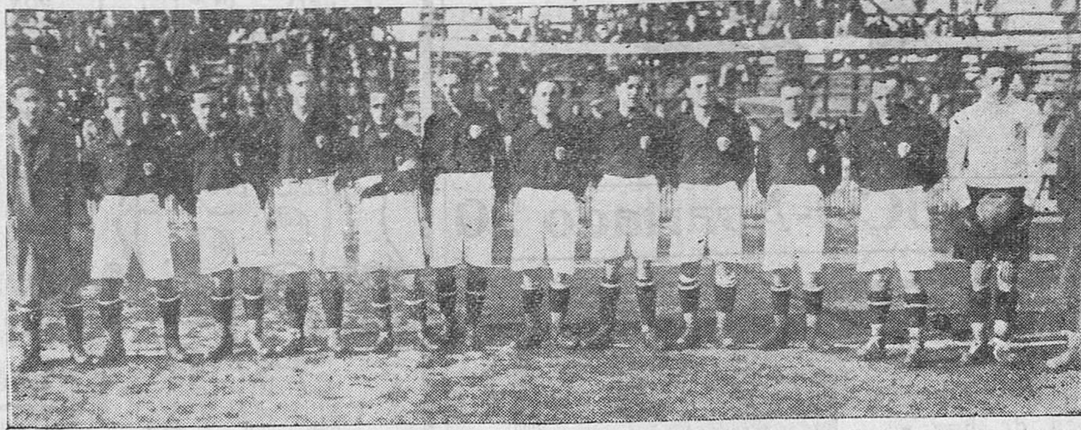
COSAS DE OTROS TIEMPOS. — El equipo selectivo de Cantabria que jugó contra Aragón...