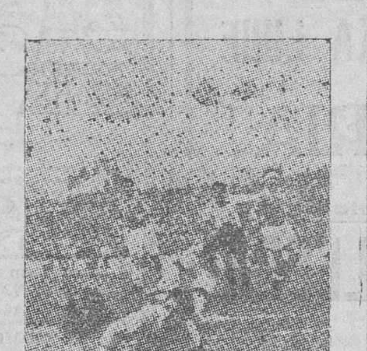
Así clavó Chas, en la meta del Madrid, el tercer goal, goal imponente que levantó oleadas de entusiasmo en los millares y millares de espectadores.

Y lo juzgo así, de mal trance, por aquél y dos motivos más, tan sencillos como distintos: primero, porque al corresponder a esa amable y honrosa solicitud de «Sollerius» sé que impugno mis propias convicciones y rompo con algo tradicional, con un criterio hasta hoy inflexible en mí, desde que me