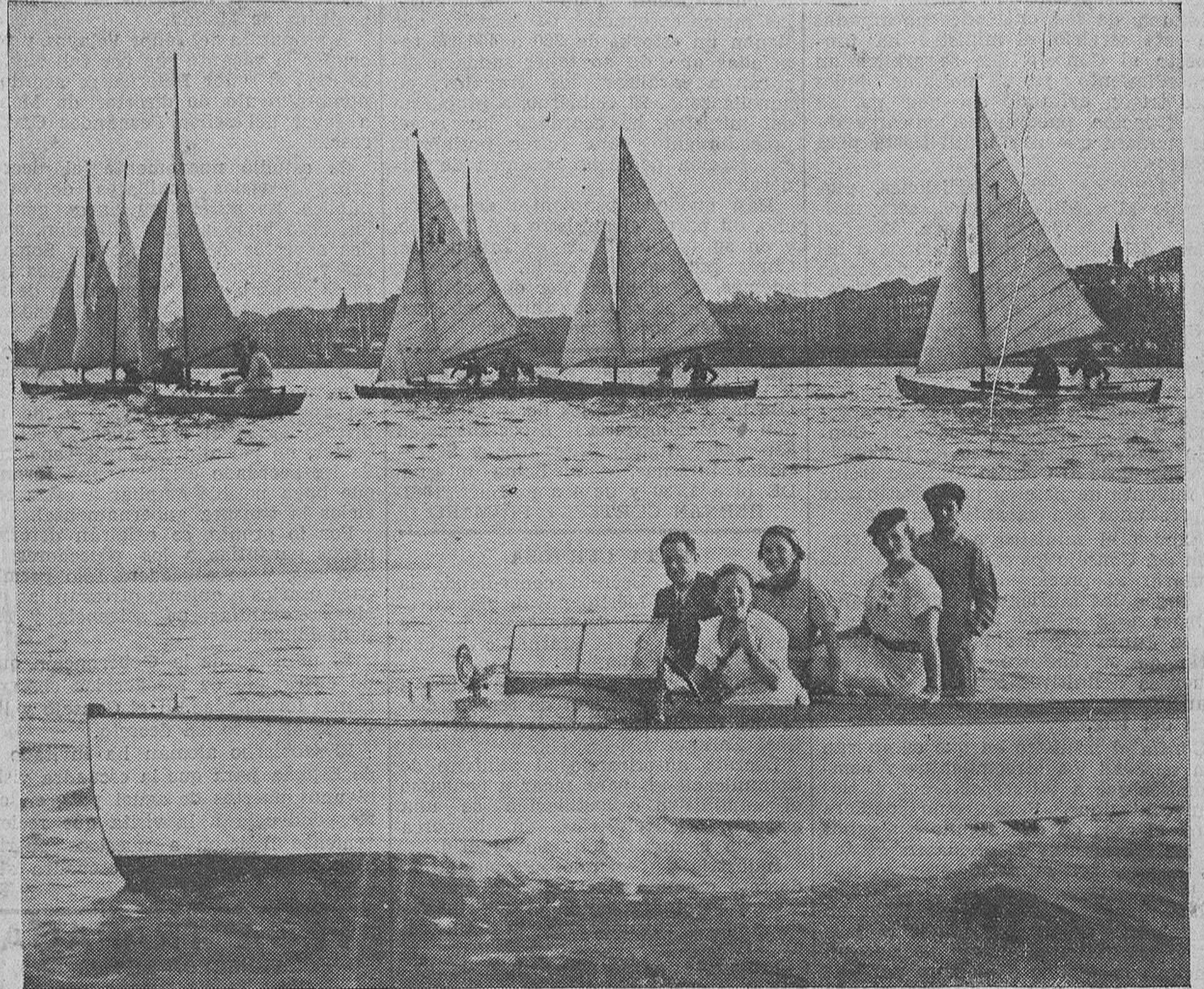
LAS REGATAS DE AYER. — Aspecto de la bahía a la salida de las lagunejas, y una gasolinera con bellas señoritas siguiendo la prueba, que resultó interesantísima.

PARA MUEBLES ECONOMICOS Y MODERNOS RIBALAYGUA