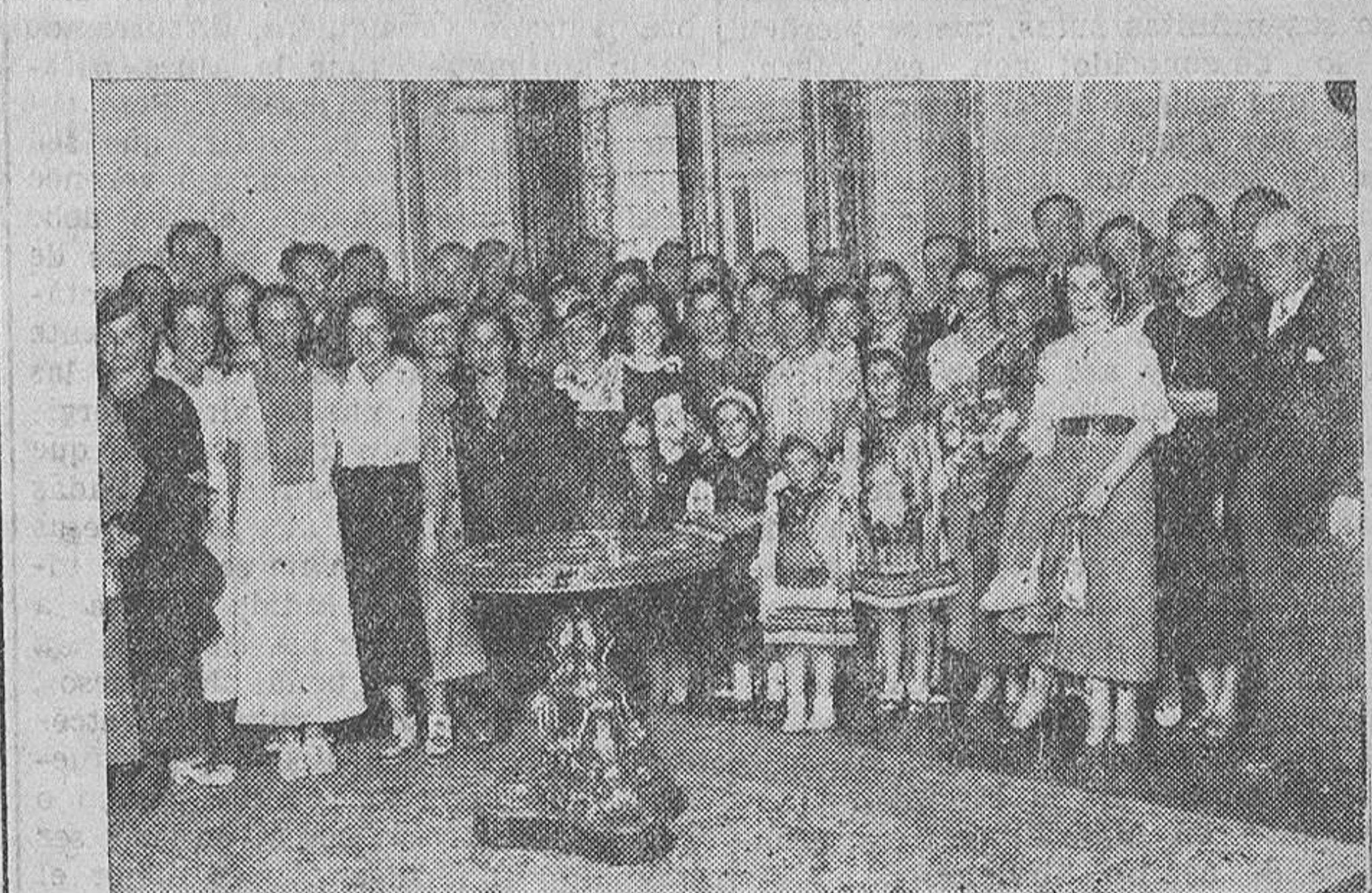
LAS JUGADORAS DE HOCKEY GIJONESAS.—Recepción en el Ayuntamiento de las bellas señoritas gijonesas, que esta tarde jugarán un partido en los Campos de Sport a beneficio de la Cocina Económica.