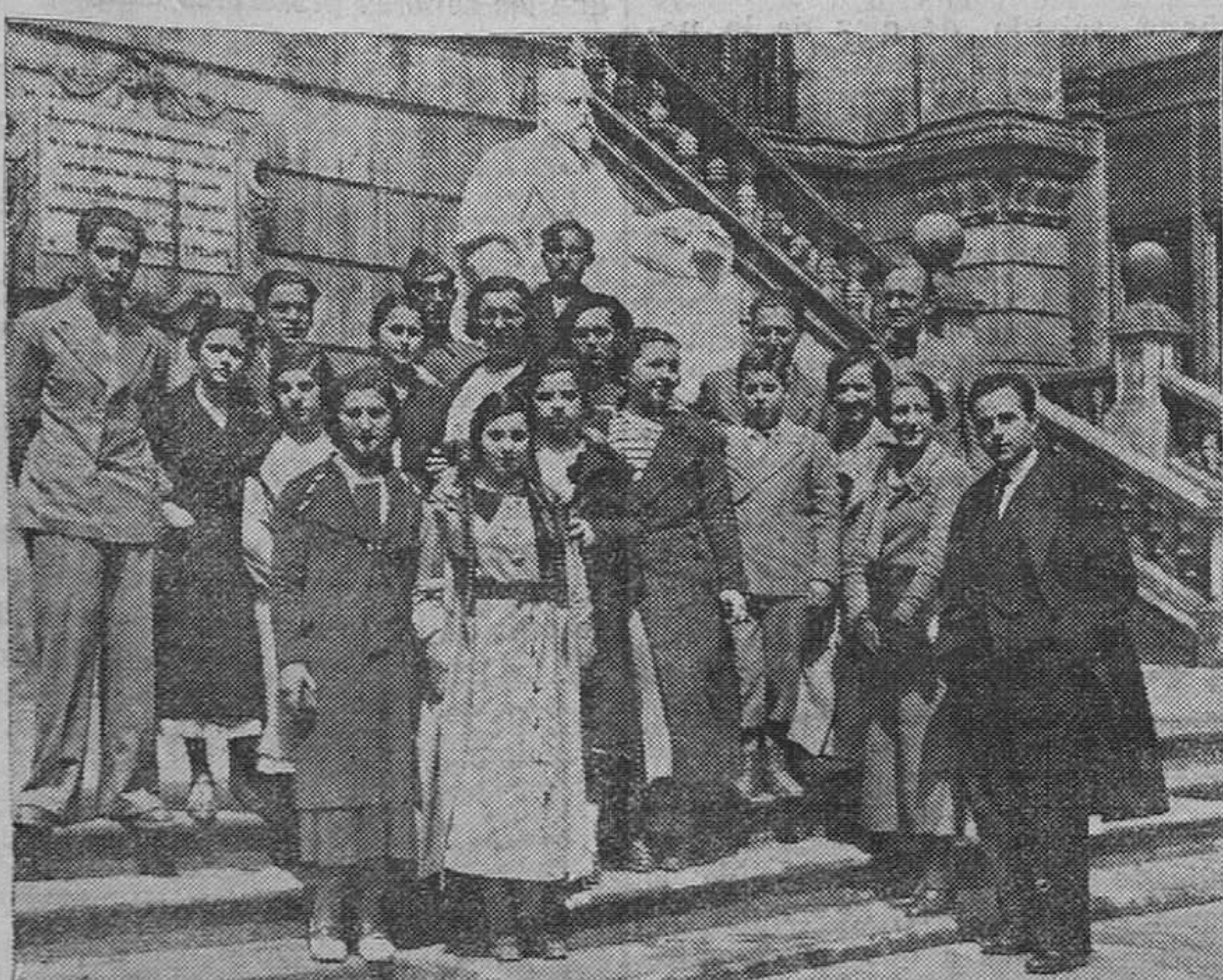
Alumnos del Instituto de Mieres, que ayer estuvieron en nuestra ciudad, visitando la Biblioteca de Menéndez y Pelayo.