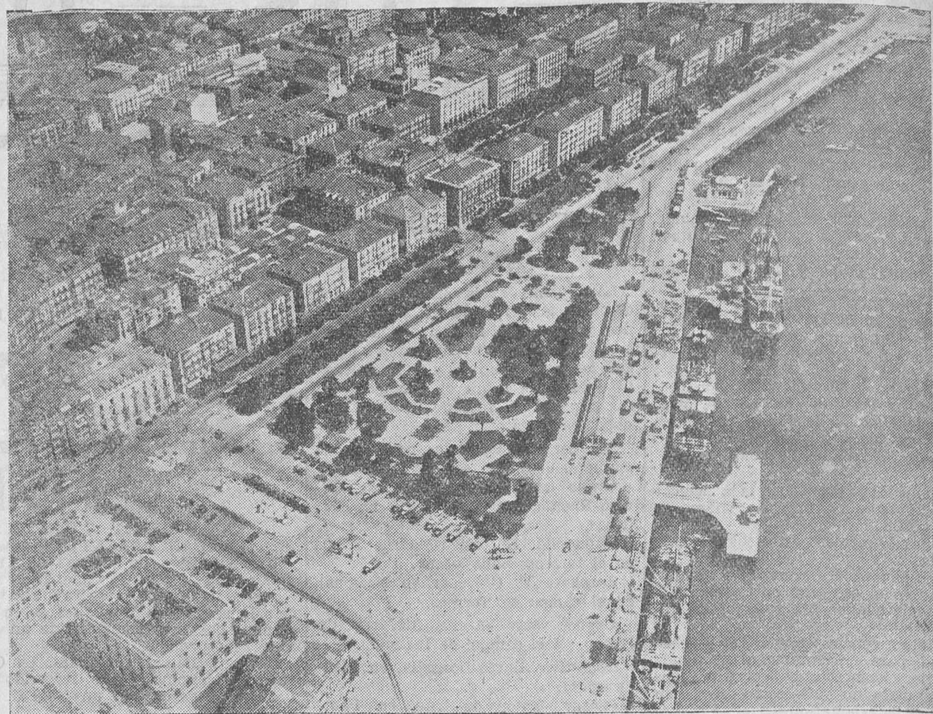
SANTANDER VISTO DESDE ARRIBA. — El paseo de Pereda, desde un avión, es algo verdaderamente grandioso. Véase, si no, la foto que publicamos.