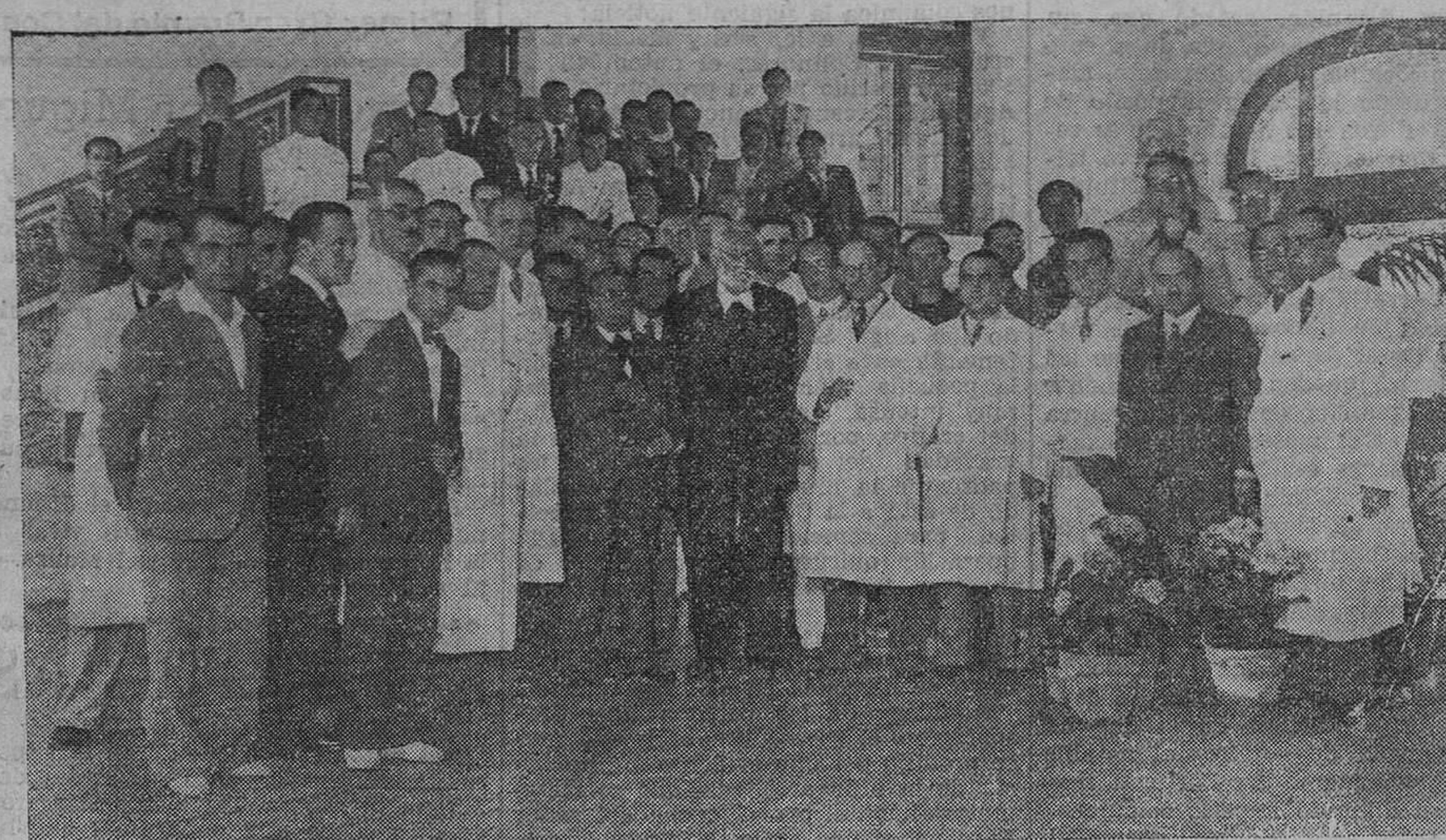
EN LA CASA DE SALUD VALDECILLA. — Don Miguel de Unamuno en su visita a esta institución, acompañado del doctor Del Río Hortega y otros médicos de la Casa.

Y como desmotivación de que la historia se repite, ahí van los nombres