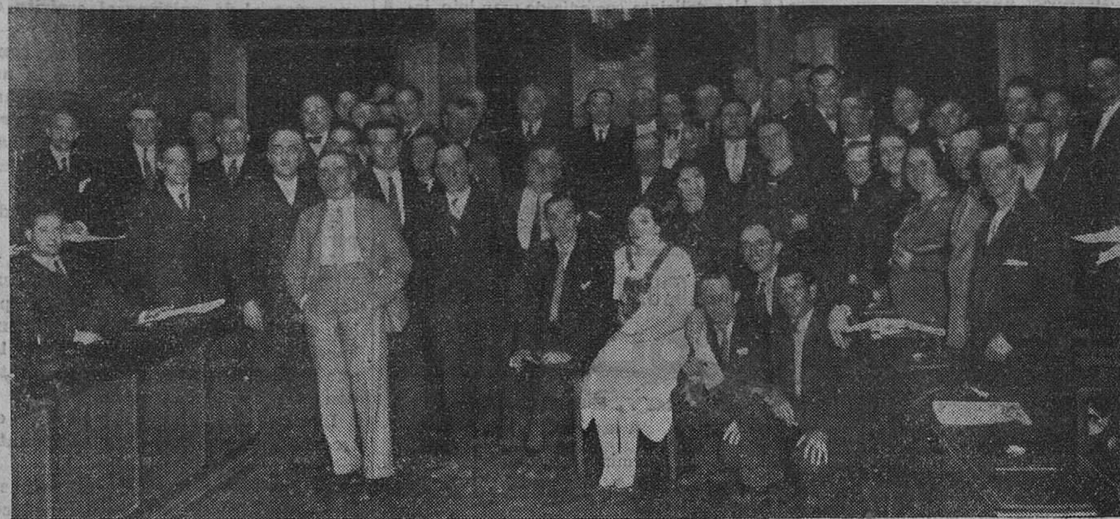
Los empleados de administración de los Ayuntamientos, en un alto de la importante asamblea que celebran estos días en la Casa Consistorial de Santander.