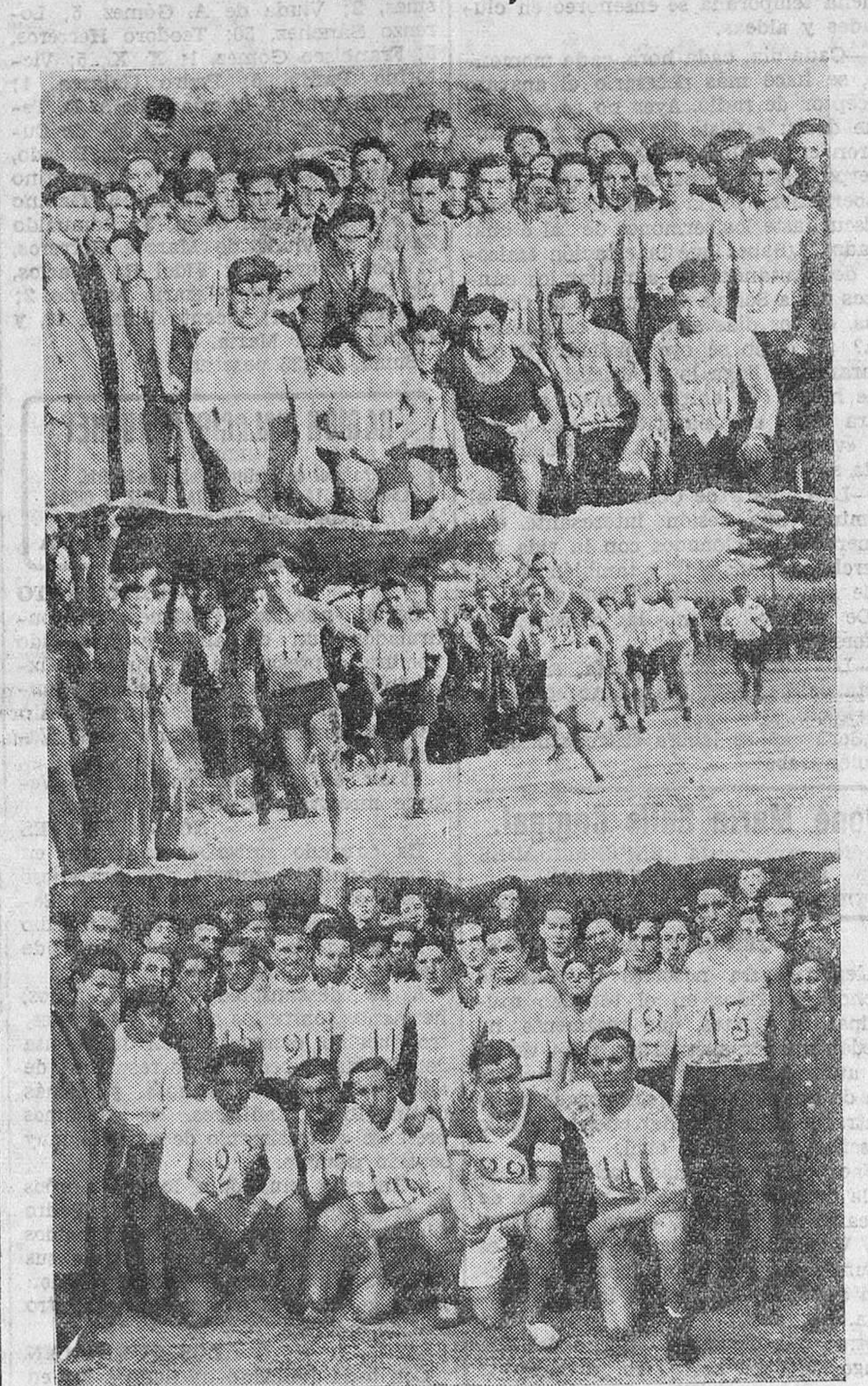
EL CAMPEONATO DE LA MONTAÑA. — Arriba, los corredores que participaron en el mismo. — En el centro, un momento de la prueba de los militares. — Abajo, los corredores militares.

Anteayer, domingo, se corrió la prueba regional denominada Campeonato de la Montaña, sobre el circuito de la península de la Magdalena.