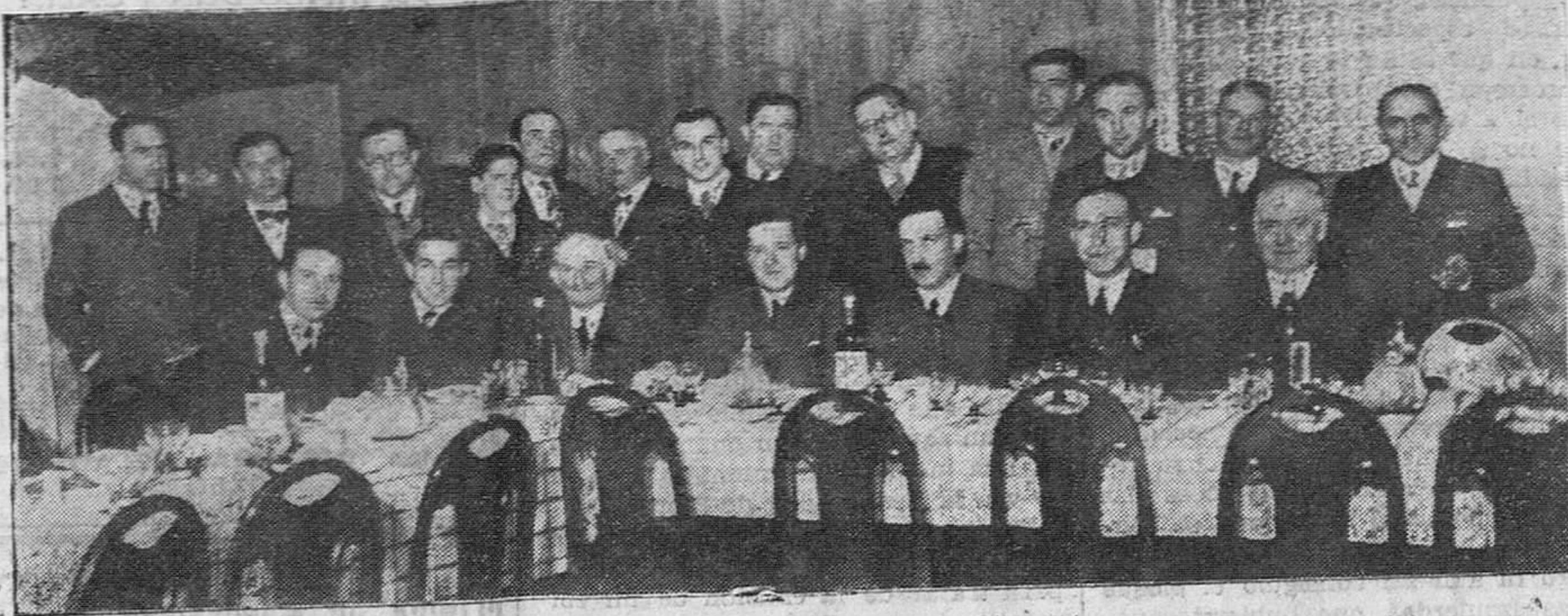
EN EL INSTITUTO PROVINCIAL DE HIGIENE. — Los médicos provinciales con el inspector señor Clavero en el banquete celebrado el sábado, como fin de los interesantes cursillos celebrados en aquel centro.

R. PRESMANES DENTISTA Fuente, 1 duplicado, principal.