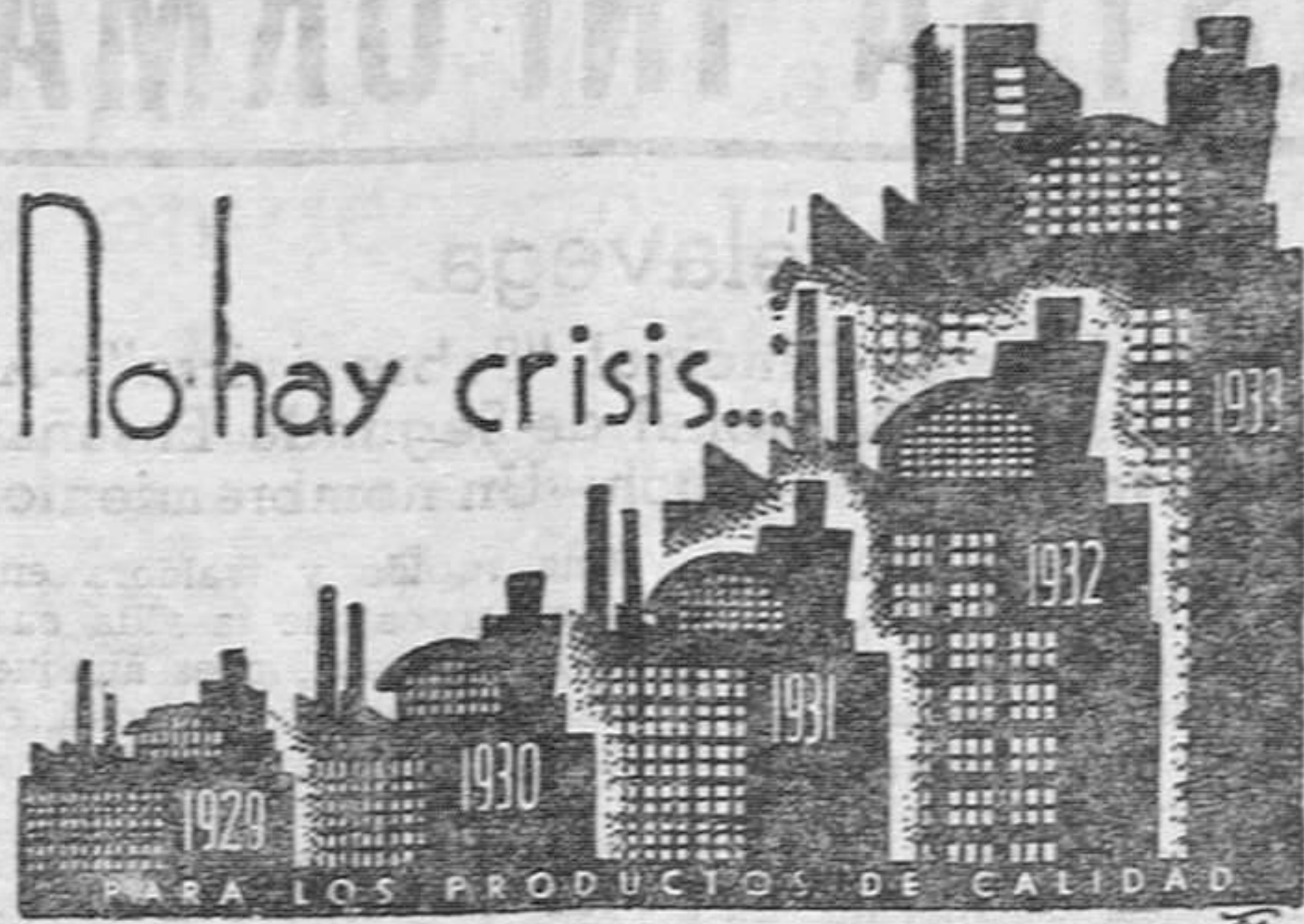
Las ventas del papel de fumar SMOKING aumentaron considerablemente en periodo de crisis.

Ahora hasta el domingo, a la misma hora y en el mismo pueblo, el segundo encuentro. Caso de salir airoso en éste el Toraya, se celebrará un tercer partido, que se jugará con seguridad en el campo del Astillero, por ser neutral para ambos.—Hockey.