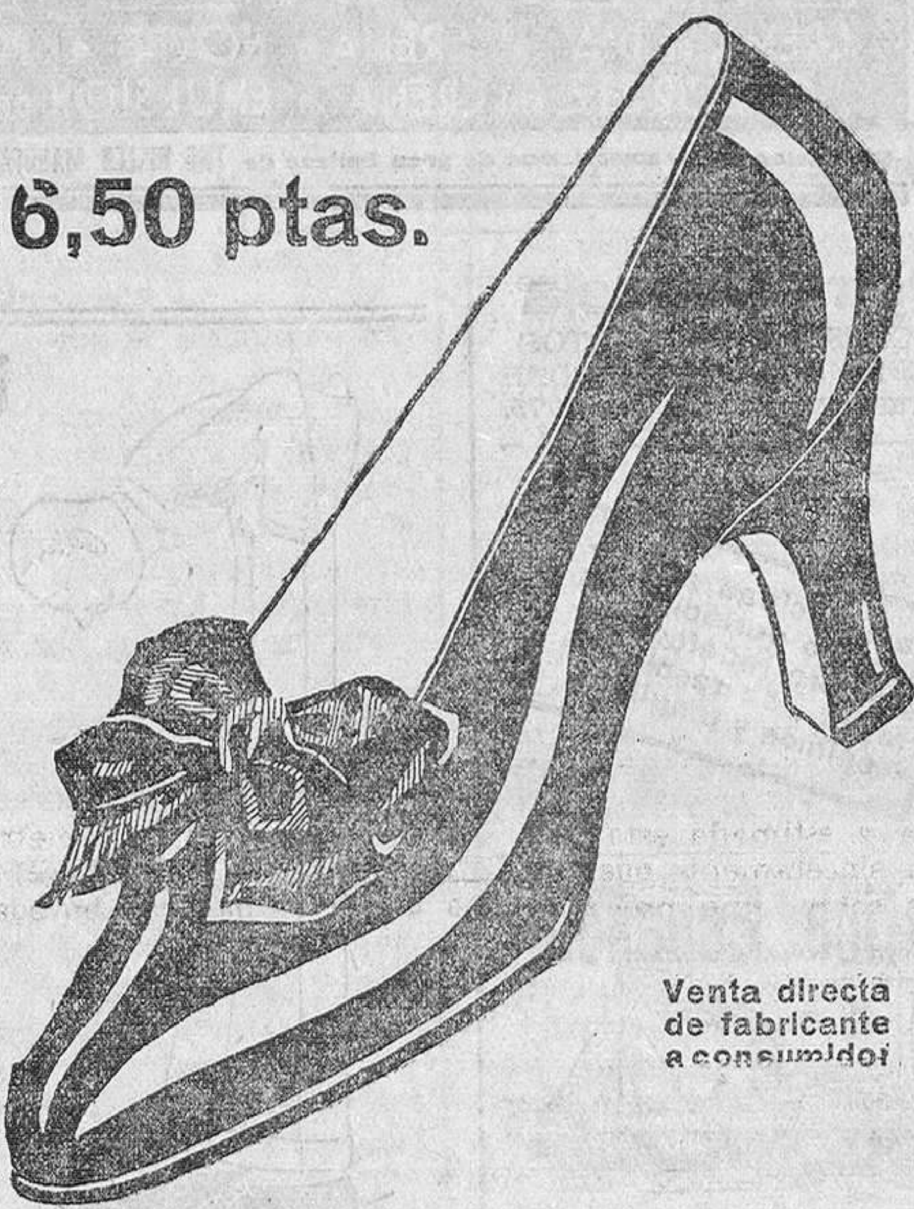
Venta directa de fabricante a consumidor