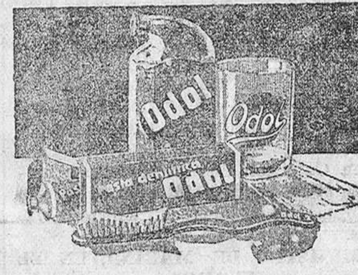
PRECIOS PARA TODA ESPAÑA (IMPUESTOS COMPRENDIDOS) EL FRASCO GRANDE 425 Ptas., EL PEQUEÑO 275 Ptas. TUBO 2 Ptas.