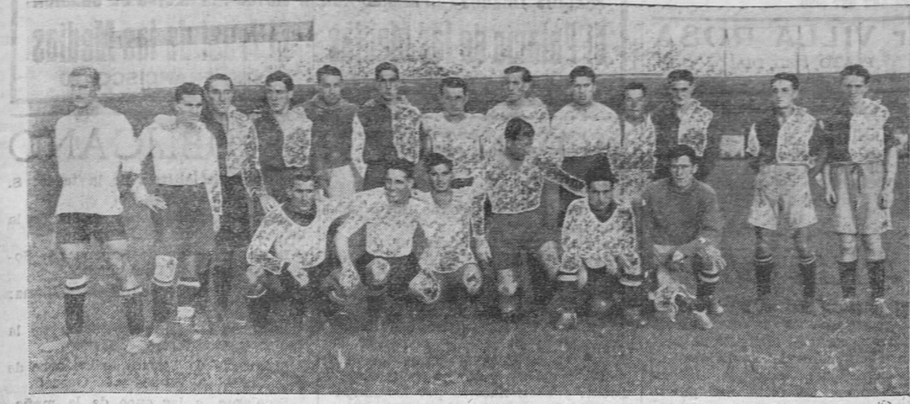
Los jugadores del Racing Club, que ayer jugaron un encuentro de entrenamiento, con algunos elementos del equipo Tolosa Sport.