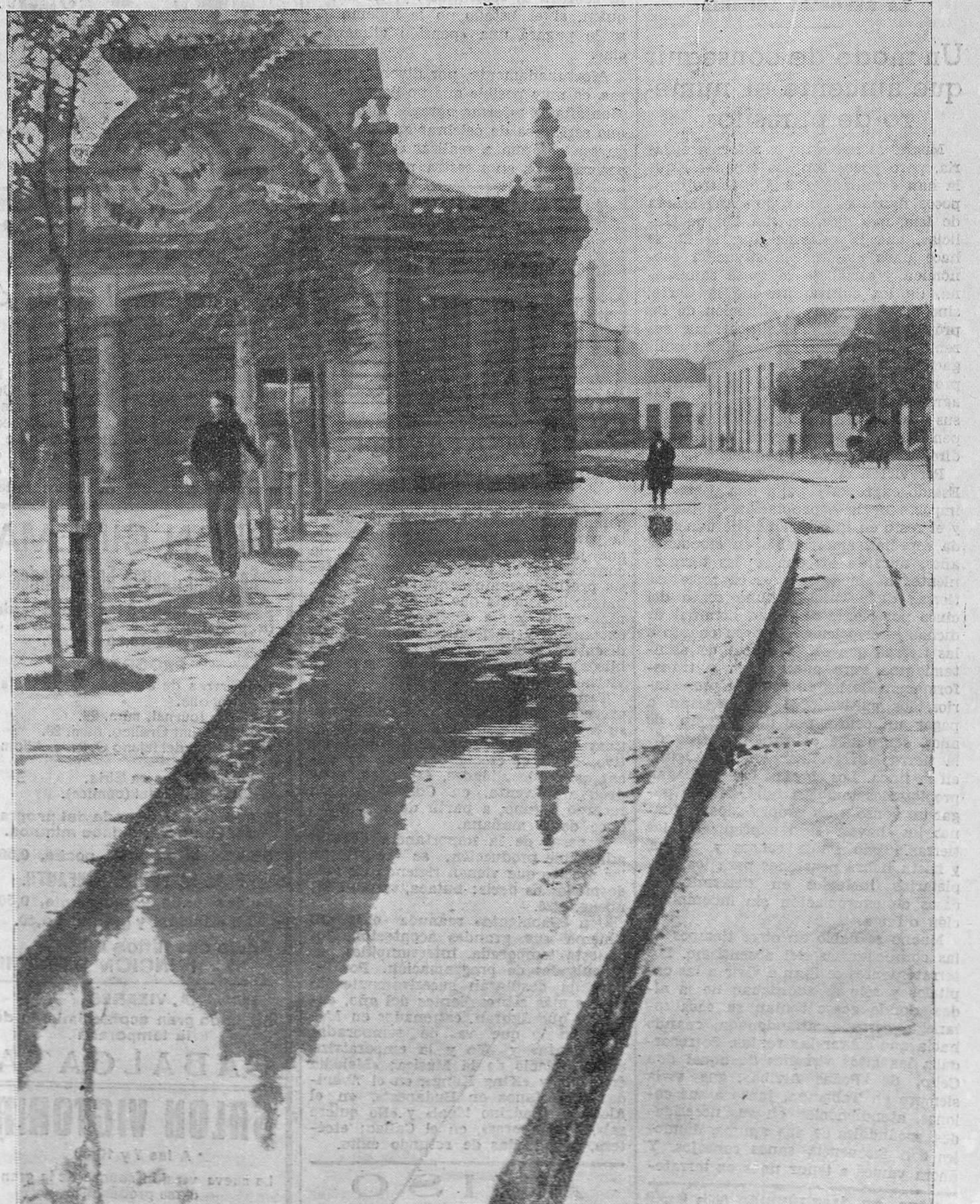
LAS OBRAS MUNICIPALES. —Nuestro Ayuntamiento, en lo que concierne a las obras llevadas a cabo en la población, está dejado de la mano de Dios. Ni una sola puede darse por terminada, y para que se vea la verdad de esta afirmación, ahí tienen nuestros lectores el andén construido en la calle de Castilla. Unos sacos de cemento bastarían para dar término a esta obra, cuyo estado de abandono ruboriza. Pero verán ustedes cómo no se echan y se espera a que el pozo sea tan grande que pueda entrar en él cómodamente cualquier trasatlántico.

Y si hay que enseñar a los escolares a reproducir del natural, por medio del dibujo, las cosas que les rodean, muy conveniente será que se estimule ese trabajo por medio de los concursos de dibujos infantiles, bastante más útiles para la infancia que los concursos veraniegos de dibujo en la arena. Si hubiese por acá un intenso amor a la enseñanza, se anunciaría en Santander un concurso de dibujos infantiles, con el fin de efectuarle en la próxima primavera. De este sencillo