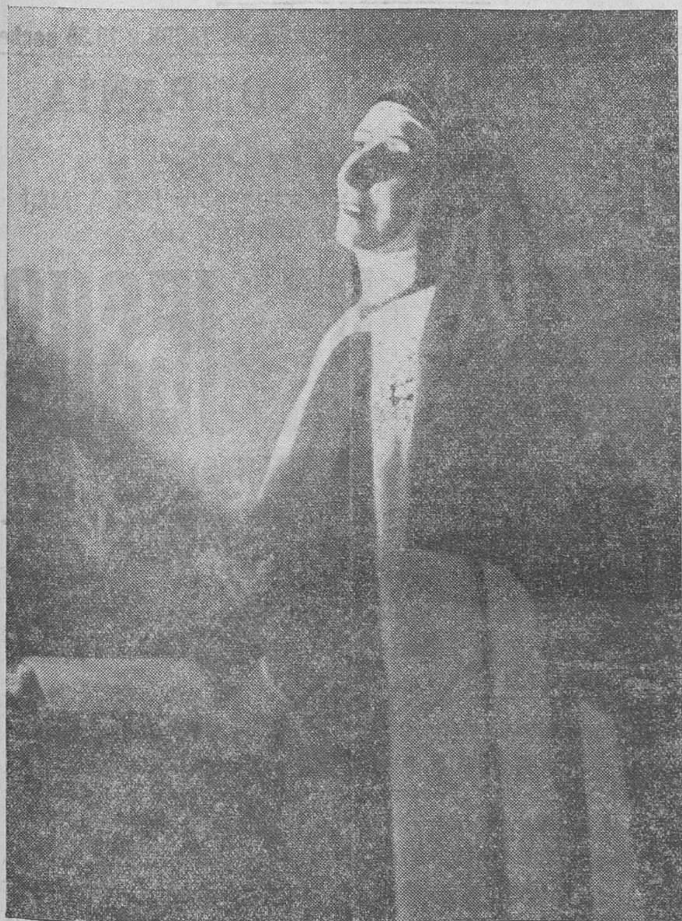
LOLA MEMBRIVES, EN «TERESA DE JESUS».—Santander, como otras capitales de España, se rendirá ante la sin par belleza de este poema de Eduardo Marquina, que recorre triunfalmente España a través del arte excelso de LOLA MEMBRIVES, y que se estrena hoy, viernes, a las seis y media, en el TEATRO FEREDA.

Al propio tiempo la Cámara llama la atención de todos los propietarios que deben tener en cuenta la responsabilidad subsidiaria que puede alcanzarse en el caso de que algunos de los obreros que trabajen en sus inmuebles se lesione en forma que produzca incapacidad permanente o muerte, para lo cual es de gran conveniencia obtener la máxima garantía de que los patronos de dichos operarios los tiene asegurados debidamente.