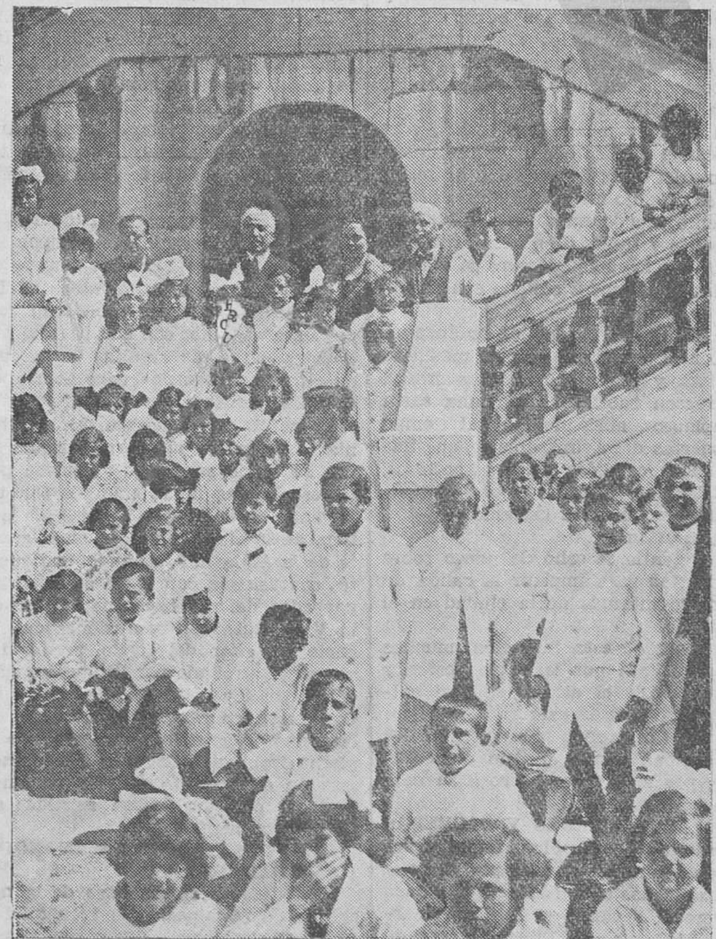
MADRID.— Los niños del Grupo escolar «Rosario de Acuña» han sido obsequiados por el presidente de la República con espléndidos donativos en el acto de inaugurarse el edificio.

Leopoldo Rodríguez F. Sierra MÉDICO RADIÓLOGO Especialista en Piel, Secretas y Radium-terapia. Consulta de diez a una.—Muelle, 20.—Tel. 28-38.