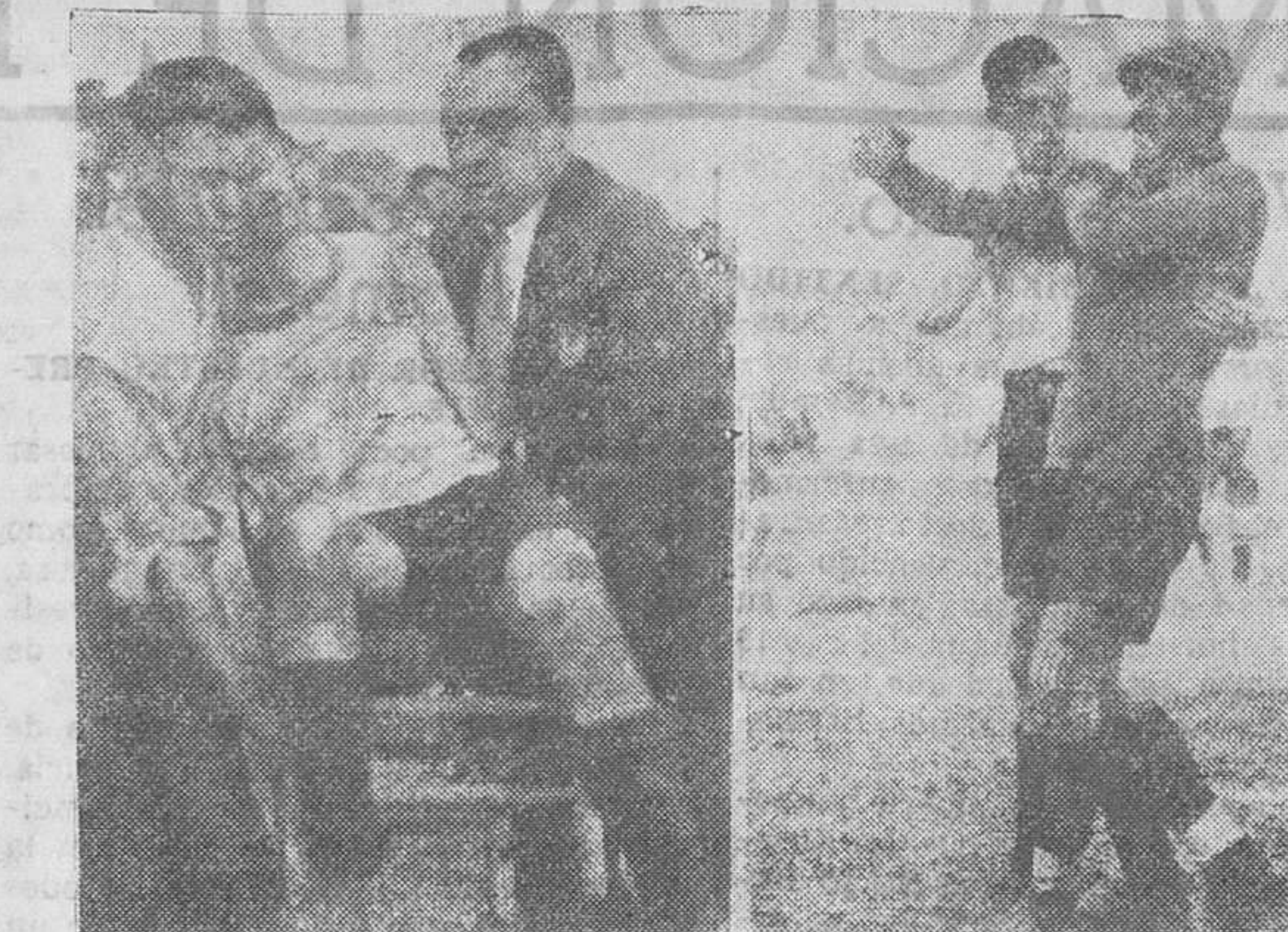
Mucho se ha discutido, dentro y fuera de casa, nuestra crónica, enviada desde Sevilla, de la matón Betis-Racing. Como ratificación de cuanto escribimos...

INVENCIABLE, 1; SOTO-IRUZ, 1 El resultado demuestra la gran lucha que pusieron en el mismo ambos clubs.