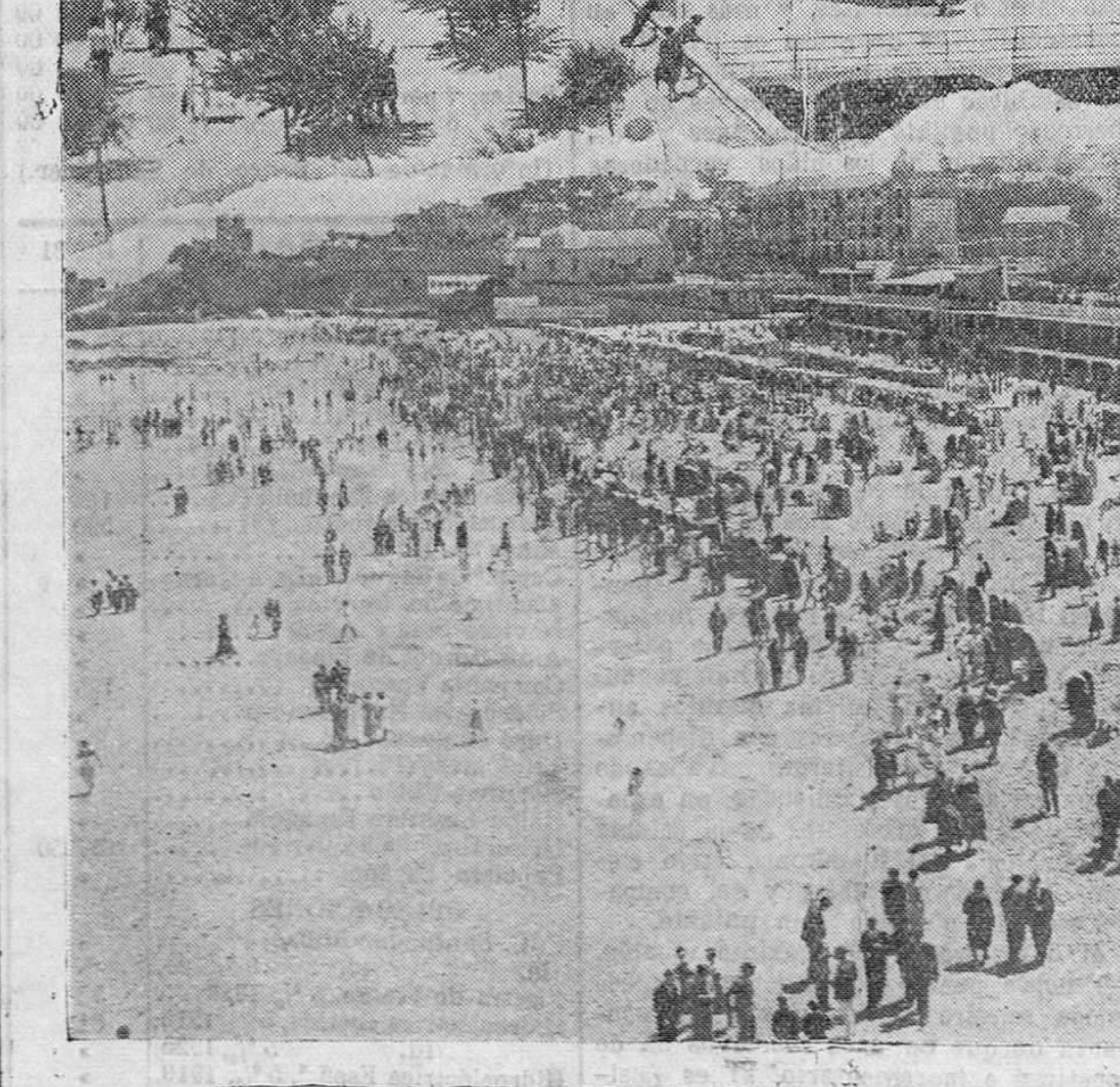
MARANAS DEL SARDINERO. — Ya ha terminado agosto y no se nota en las playas, que est6n igual de animadas que al comenzar el mes del calor. Los paseos, las terrazas bajas y las playas se llenan de gente, ansiosa de disfrutar del aire fresco del mar, en estos dias que, seg6n dice el tel6grafo, se est6n asfixiando en el centro de Castilla.